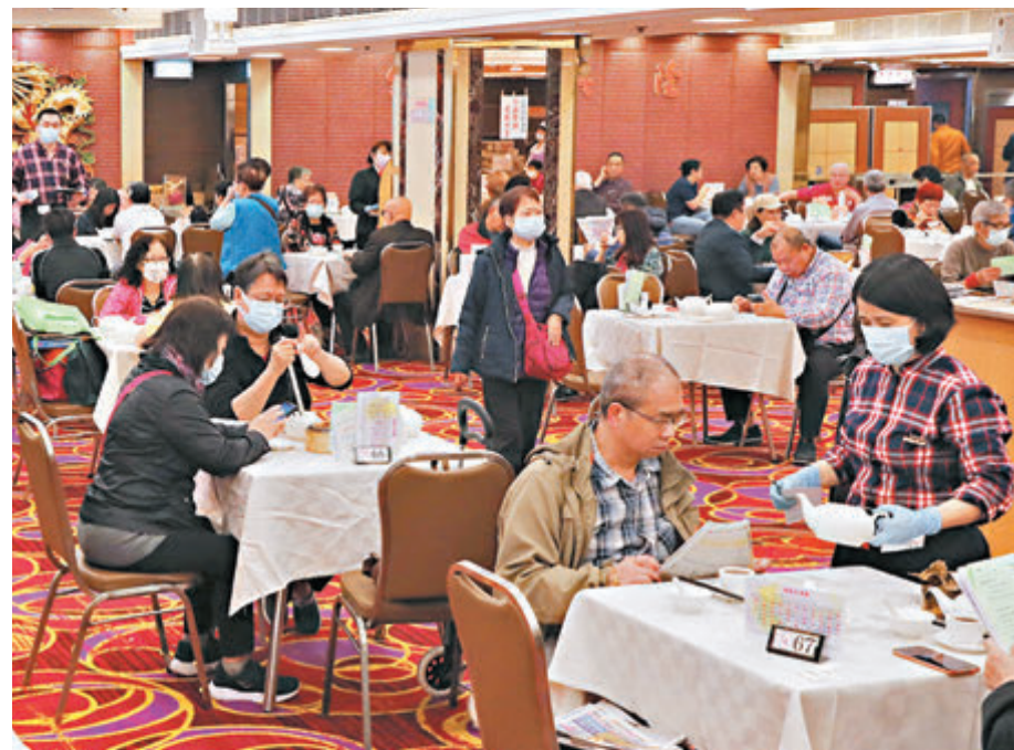
▲疫情緩和，食肆明日起可恢復晚市堂食至10時，並容許4人一枱。