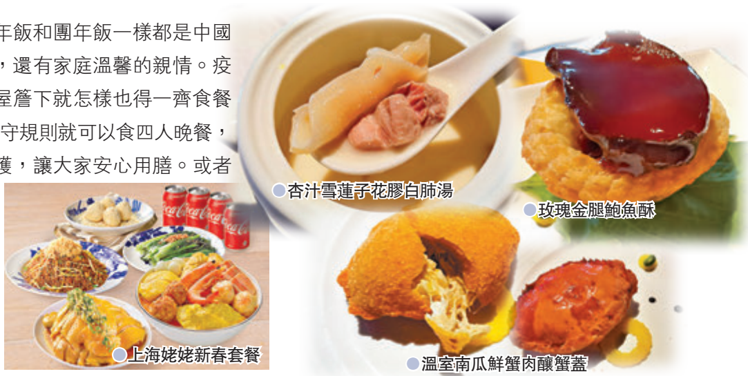
● 杏汁雪蓮子花膠白肺湯