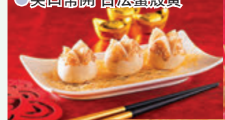
● 財源廣進 金絲紅燒元寶