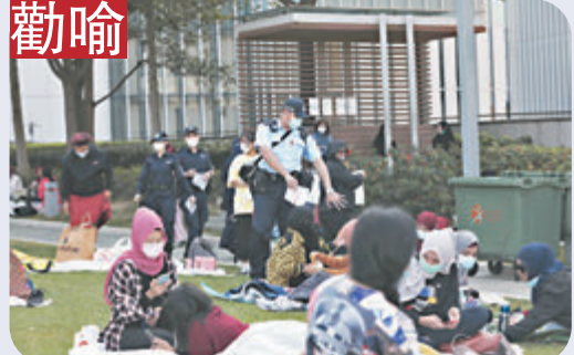
政府多個部門採取聯合行動，向現場人士作出勸諭。