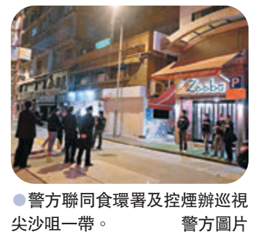
警方聯同食環署及控煙辦巡視尖沙咀一帶。

自新冠疫情爆發，漁護署去年7月15日起已關閉轄下郊野公園內的163個燒烤地點及41個露營地點。職員在農曆新年期間亦加強巡查多個地點，結果在前日共發現有24人違規在多個郊野公園內露營，須採取執法行動，包括向13名違反「限聚令」者發出定額罰款通知書。在尖沙咀警區聯同食環署及控煙辦以及康樂及文化事務署人員，則分別在前日及昨日巡視區內食肆、酒吧、派對房間以及康樂及文化場地。其間一名25歲女子因沒有佩戴口罩及在禁煙區吸煙，被發出定額罰款通知書；加拿分道一食肆則因違反「限聚令」在傍晚6時後仍然營業，33歲男負責人及一名29歲男負責人作出檢控，另向5人（19歲至32歲）發出定額罰款通知書。