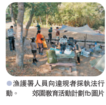
漁護署人員向違規者採執法行動。 郊園教育活動計劃佈局圖

香港文匯報訊（記者 蕭景源）農曆新年假期期間，不少市民不顧疫情繼續犯聚，警方聯同食環署、控煙辦、康樂及文化事務署及漁護署等部門，前日至昨日巡視尖沙咀、觀塘及灣仔一帶酒吧、食肆、派對房、康樂及文化場地，以及多個郊野公園，其間逾百人分涉違反「限聚令」、「限聚令」或「口罩令」被捕或票控。