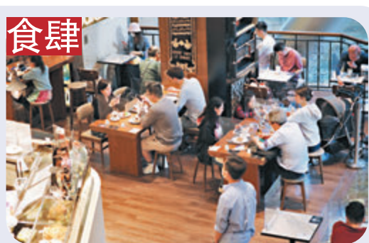
有餐廳在4人枱中間只設置簡單的隔板，讓食客近距離坐下。