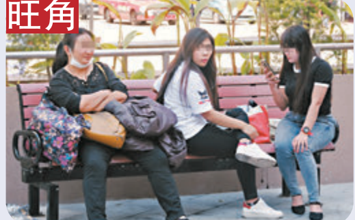
旺角有外傭除罩聊天。