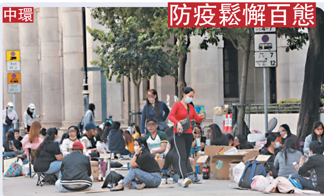
中環外傭聚集，有不少外傭三五成群坐在紙皮上玩牌、脫下口罩進餐及高談闊論。

他認為最重要是讓本港與內地通關，人員恢復正常往來，才對本港旅遊業有更大幫助，認為政府應進行更多強制性檢測，讓個案清零，並加強疫苗接種計劃的宣傳，這樣才有條件與內地商討通關事宜。