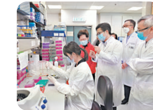
林鄭月娥（左二）聽取有關污水樣本消毒和預處理過程，以及污水新冠病毒檢測的最後程序的介紹。