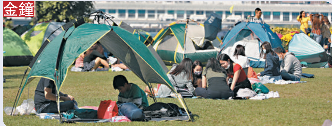
金鐘總匯外不少人聚集，亦有人脫下口罩。