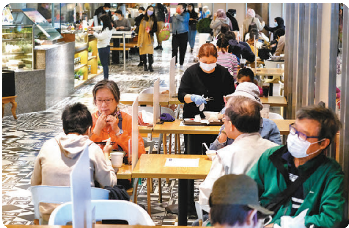
●本港疫情稍有緩和，昨日新增確診個案跌至單位數，如疫情無大變化，食肆晚市堂食本周四起可望放寬。

衛生防護中心傳染病處首席醫生歐家榮昨在疫情簡報會上指出，新增的9宗個案中，5宗為輸入病例，本地感染個案只有4宗，當中3宗源頭不明，另外有少於10宗初步確診個案。翻查資料，上一次錄得單位數確診為去年11月18日，當日同有9宗個案，而11月19日則有首宗跳舞群組個案，揭開第四波疫情序幕，當日有12宗確診病例，至11月29日時確診個案更高達115宗。