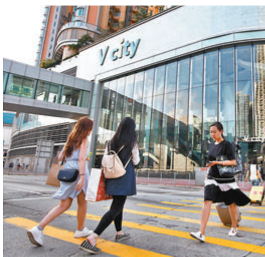
●屯門大型商場V city的Balencia麵包店有師傅確診。圖為V city外觀。資料圖片

染疫消防隊員本月4日出現上呼吸道病徵後，持續上班直至上週三(10日)早上，只自行服用成藥和感冒藥，傳染期內的上週二(9日)曾到過青衣及青衣南消防局替更，而潛伏期內則到過元朗合益街市。