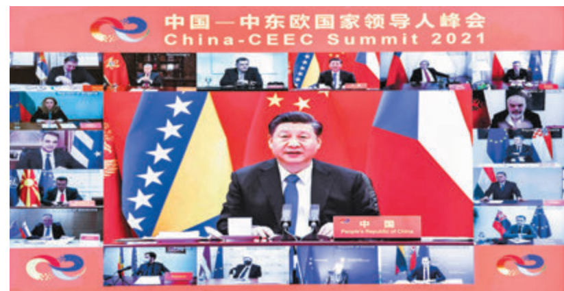
● 習近平以視頻方式主持中國-中東歐國家領導人峰會。 新華社

重大，將成為中東歐國家-中國合作新的重要里程碑。各方願繼續參與這一合作，同舟共濟，攜手抗疫，共促經濟復甦，踐行多邊主義，共同應對各種全球性挑戰。各方讚賞中方為國際抗疫合作作出的重要貢獻，特別是習近平主席承諾將中國疫苗作為全球公共產品，希望同中方加強疫苗及公共衛生領域合作。各方贊同習近平主席提出的各項務實合作主張，願積極共建「一帶一路」，擴大對華商品出口，歡迎中方企業前往投資，推進互聯互通、科技創新、數字經濟、綠色發展等領域合作，便捷人員往來，深化人文交流，推動合作取得更多成果，更多造福各國人民。各國領導人紛紛向中國人民拜年，祝願中國人民新春快樂，牛年吉祥。