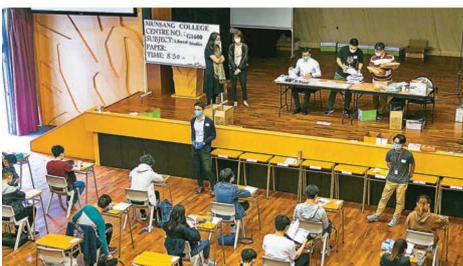
●林鄭月娥希望社會能以客觀持平的態度看待通識科改革。圖為去年文憑試通識科考場。

及立法會對科目改革的接受程度也相當高。新課程內容框架包含「『一國兩制』下的香港」及「改革開放以來的國家」兩個核心部分，但有關的國民教育卻遭攪炒派炒作及污名化。林鄭月娥指，新科目目的及涵蓋範圍不同於「國民教育科」，而是為了替代現有通識科，讓學生了解國家、了解香港、了解世界，最終名稱仍有待大家商討。 她表示，了解到現通識老師對科目改革的關注，包括牽涉到重新學習與培訓，強調特區政府「一定會支持在學校層面，或者在教育局層面多安排這類有關新科目的培訓」。事實上不少通識老師亦有教授經