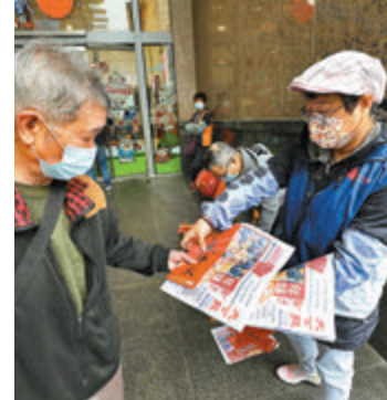
●市民排隊領取《大公報》及賀年揮春。