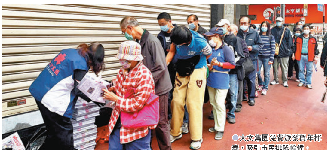
●大文集團免費派發賀年揮春，吸引市民排隊候領。