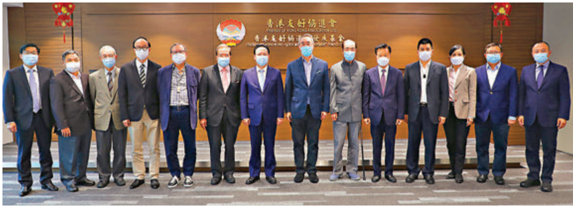
●譚鐵牛（左七）到訪香港友好協會，與唐英年（右七）等首長合照。

香港友好協會會長唐英年對譚鐵牛一行的到來表示熱烈歡迎，對「鐵牛的牛年祝福」表示衷心感謝。