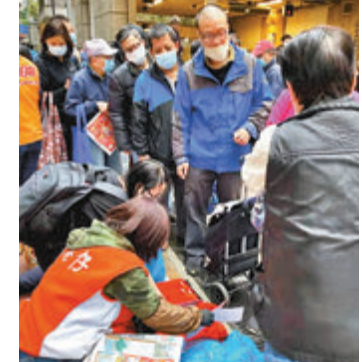
●市民排隊領取《香港仔》及賀年揮春。

香港文匯報訊（記者 子京）新春佳節將至，香港大公文匯傳媒集團於廿八（2月9日）、廿九（2月10日）兩天，免費派發40萬份揮春，與廣大讀者一起共迎新春，為香港市民送上新年祝福。昨日派發期間，市民反應熱烈，開心輪候，在7時半派發前，多個地點出現了長長的排隊人龍。有市民在拿到揮春後表示，希望農曆新年後，疫情盡快清零，香港恢復正常穩定的生活。 昨日首日隨大文集團轄下三張報紙《文匯報》《大公報》《香港仔》贈送20萬份A套揮春，內容為「國安家好 春來福到」和「牛氣沖天 大人大利」。揮春除了隨報紙附送外，還在香港、九龍、新界多個商業區、港鐵站免費派發。 揮春的祝語除了「國安家好 春來福到」、