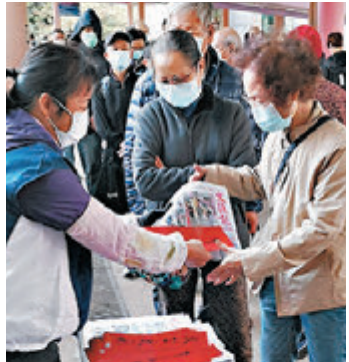
●市民排隊領取《文匯報》及賀年揮春。