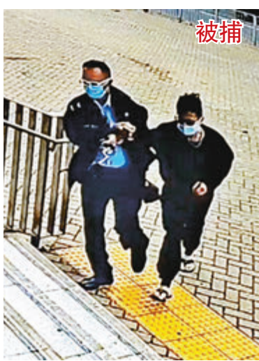
●企圖搶槍女子被拘捕押署扣查。 閉路電視截圖