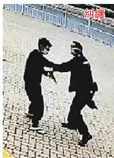
●幸警員及時奪回佩槍。