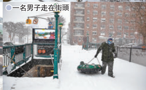
●一名男子走在街頭