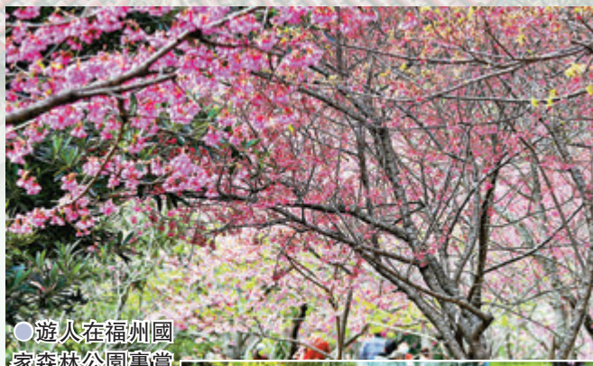
●遊人在福州國家森林公園賞櫻