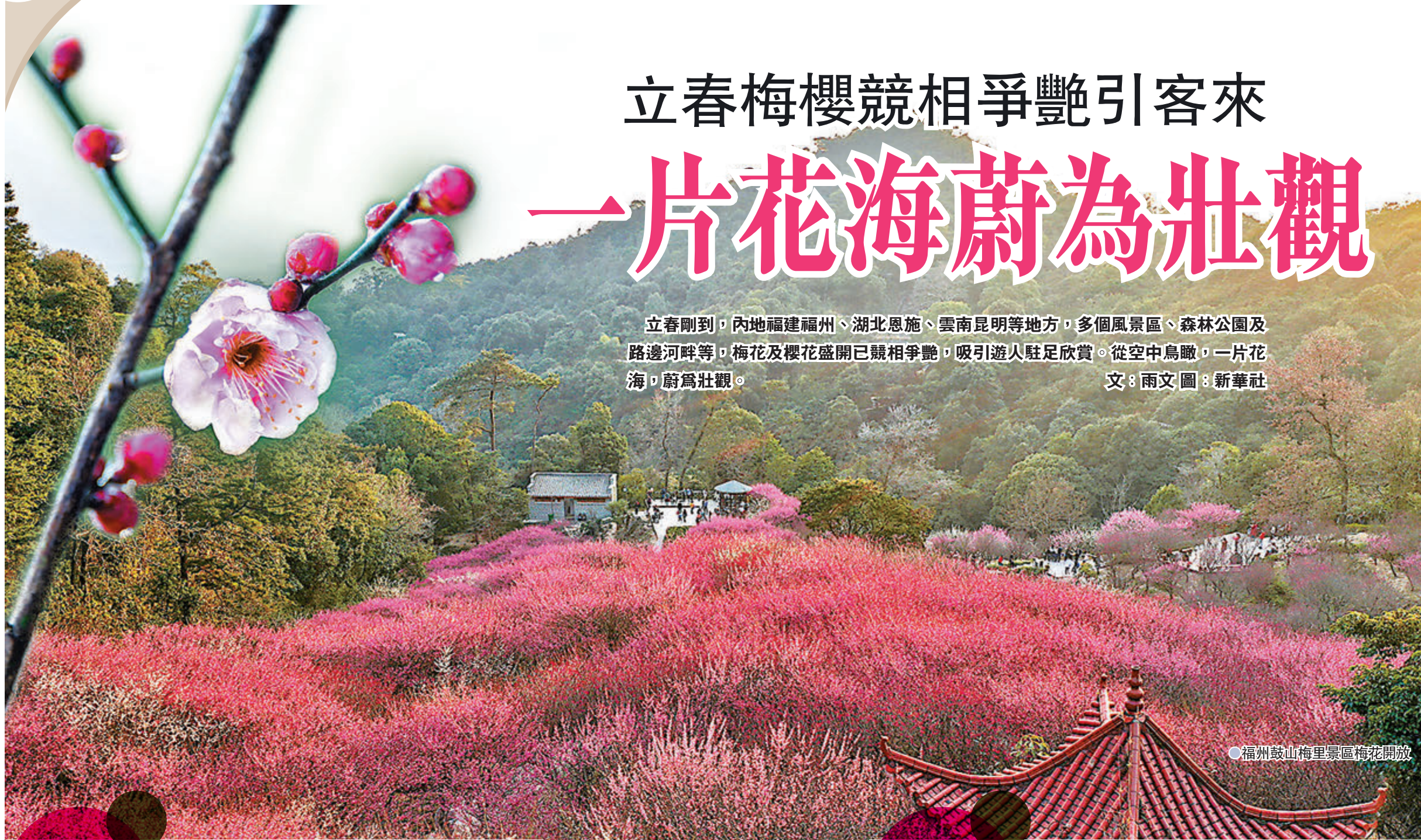
●福州鼓山梅里景區梅花開放

立春剛到，內地福建福州、湖北恩施、雲南昆明等地方，多個風景區、森林公園及路邊河畔等，梅花及櫻花盛開已競相爭艷，吸引遊人駐足欣賞。從空中鳥瞰，一片花海，蔚為壯觀。 文：雨文 圖：新華社