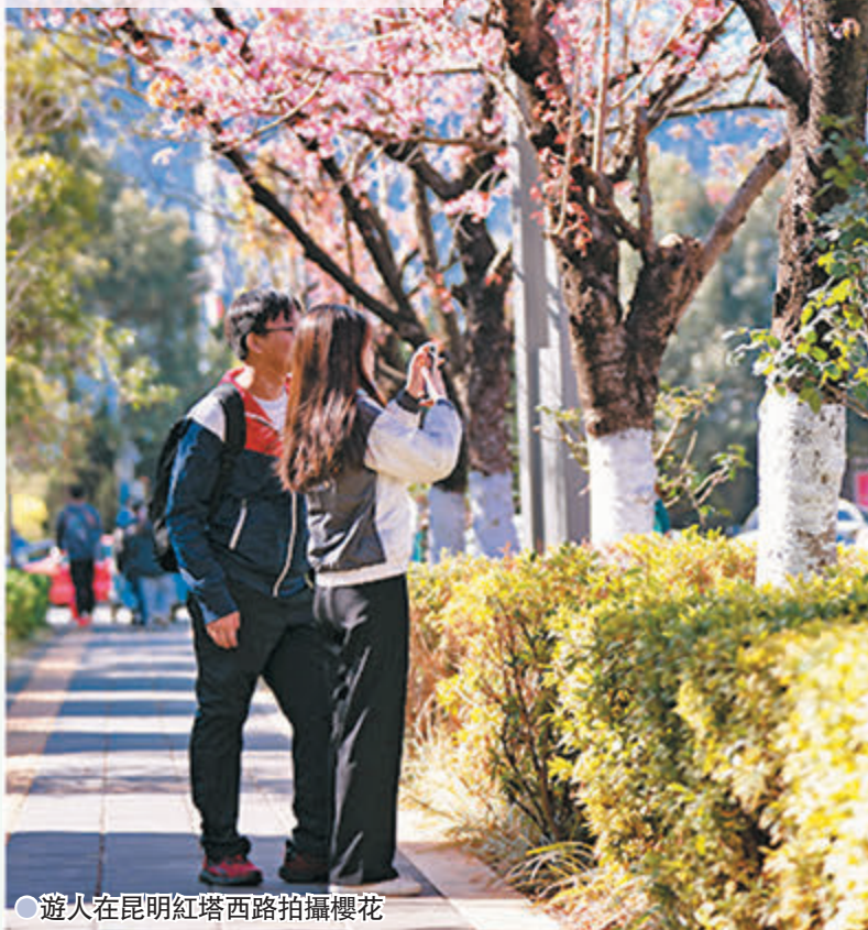
●遊人在昆明紅塔西路拍攝櫻花

早前，一場冬雨把湖北省恩施土家族苗族自治州宣恩縣貢水河畔的梅花沁潤得更加嬌艷，成為臘月裏一道亮麗的風景，不少遊人在貢水河畔拍攝梅花雨潤花紅的美景。