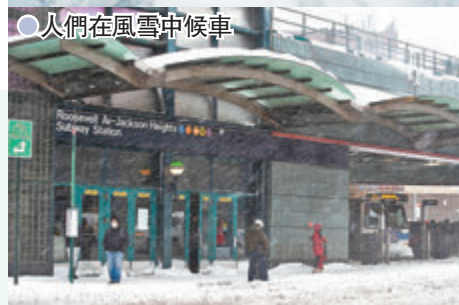
●人們在風雪中候車