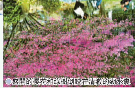
●盛開的櫻花和綠樹倒映在清澈的湖水裏

至於位於福州市新店鎮的福州國家森林公園，則是福建省首家國家級森林公園，也是福州地區六個中國4A景區之一。福州國家森林公園原名福州樹木園，創建於1960年2月，1988年經國家林業部批准建立「福州森林公園」，面積859.33公頃，分森林區、苗圃、溫室、專類園、休息區等5個部分，日前在公園裏的櫻花相繼盛開，春意萌動，吸引了不少遊客到來賞櫻。