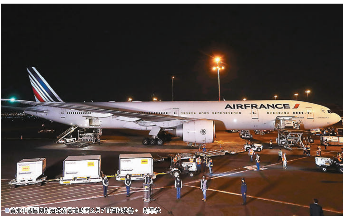
●首批中國國藥新冠疫苗當地時間2月7日運抵秘魯。

薩加斯蒂在隨後的講話中再次強調，接種疫苗是當前疫情防控最重要、有效的措施，在重症監護室等一線崗位工作的醫護人員將優先接種疫苗。他同時表示，未來一周內將有另一批中國國藥疫苗運抵秘魯。他表示，這是一項長期和艱巨任務的開始，隨着更多疫苗陸續運抵，疫苗接種工作將持續開展。薩加斯蒂同時感謝中國在疫苗採購和運輸方面給予的支持。