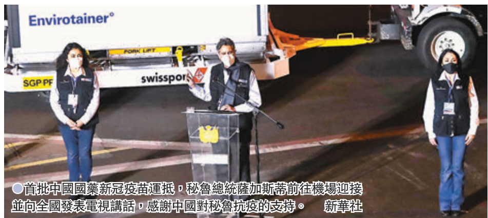
●首批中國國藥新冠疫苗運抵，秘魯總統薩加斯蒂前往機場迎接並向全國發表電視講話，感謝中國對秘魯抗疫的支持。

秘魯各大媒體當天紛紛報道中國疫苗運抵利馬的消息，國家電視台對疫苗抵達進行了全程直播。在利馬的一些街區，居民們通過燃放煙花等方式慶祝疫苗到來。在疫情陰霾仍籠罩全球的當下，中國疫苗像一縷陽光，為抗疫成功注入信心和希望。