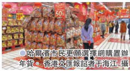
●哈爾濱市民更願選擇網購置辦年貨。

年，在菜餚搭配上也都做了調整，增加了一些南方菜。目前，訂製年夜饭套餐價格從400元到1,000多元人民幣不等，很受市民歡迎，訂單每天都有增加。 ●香港文匯報記者 于海江 哈爾濱報道