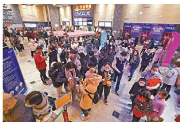
●內地影迷們去年因疫情影響未能到影院看賀歲片, 今年或會出現爆發性觀影。資料圖片