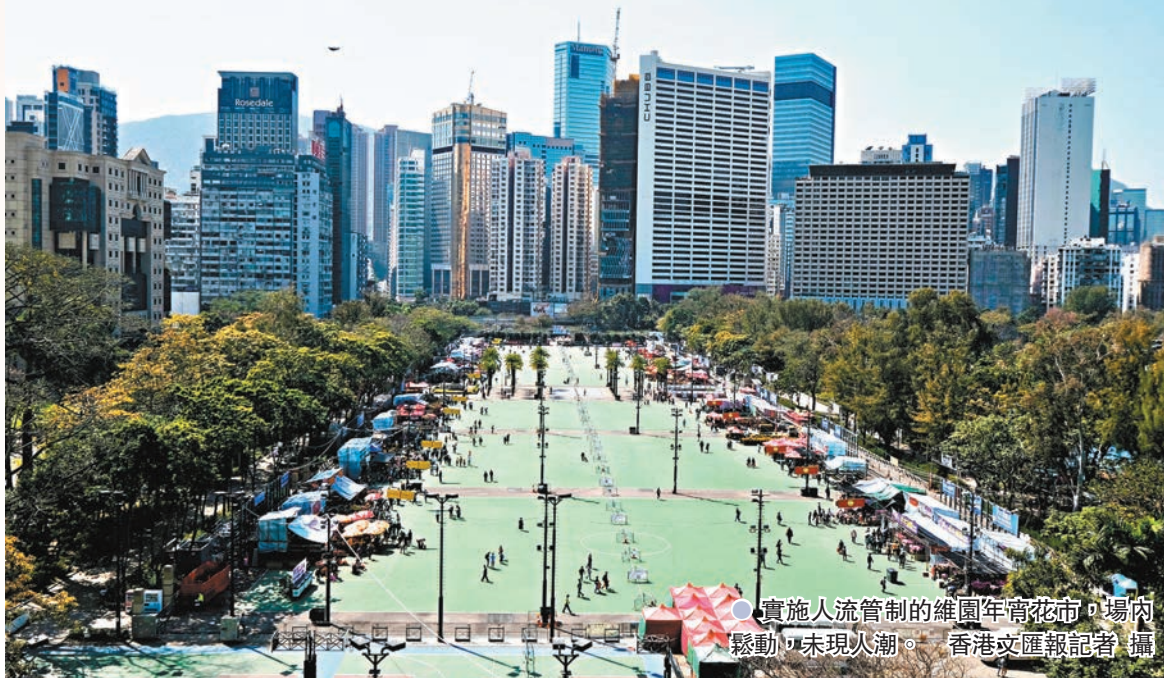
實施人流管制的維園年宵花市，場內鬆動，未現人潮。

由於昨日天氣和暖，有花農將口罩拉至下巴，即使與顧客交談及包裝花束時亦不見收斂，全程「不設防」。現場管理人員亦沒有上前阻止，亦有買花市民除下口罩透