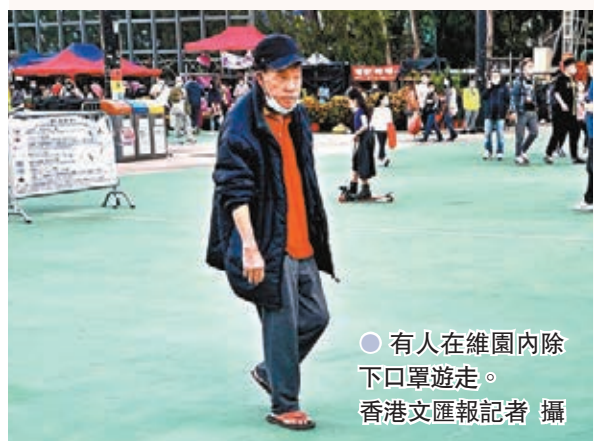
有人在維園內除下口罩遊走。

全港年宵花市昨日上午開始投入運作，位於銅鑼灣的維園年宵花市吸引不少市民前往，中午按規定清場進行清潔消毒期間，已有大批市民在場外排起長龍，準備完成場地清潔後進場。人龍之長可繞公園噴水池一圍，人與人之間距離明顯不足1.5米，更有不少市民無視二人限聚令，呼朋喚友、一家大小結伴同行。