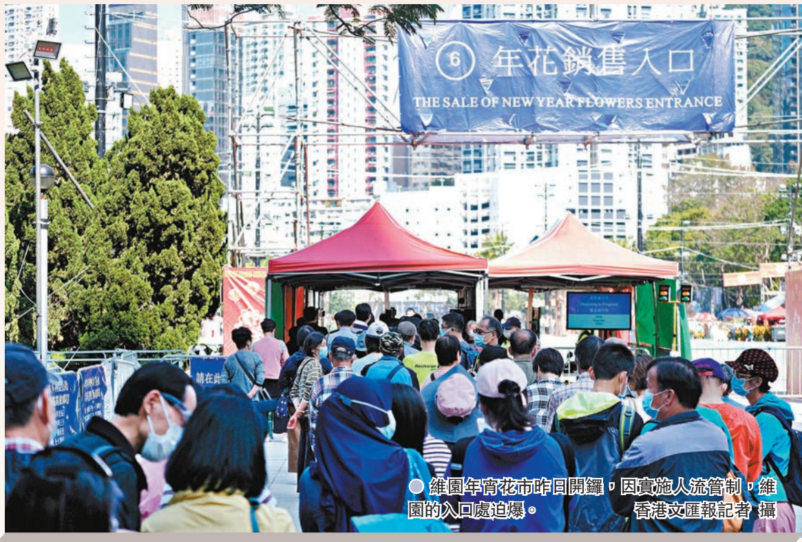
維園年宵花市昨日開鑼，因實施人流管制，維園的入口處迫爆。