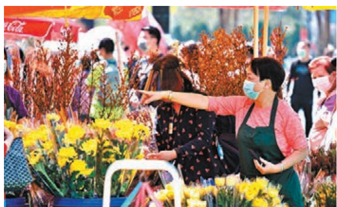
有的花檔檔主忙個手腳不停，有的則生意暴跌。