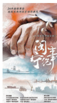
●《閩寧紀事》再現東西部對口扶貧協作時代史詩。

據介紹，紀錄片《閩寧紀事》後續將以編年體方式，持續記錄鄉村振興進程中閩寧協作的新征程新奮鬥，將「重點」和「特點」、記錄與政論相結合，講好閩寧對口協作故事，着力展現閩寧兩地山海情、幫扶情、奉獻情。