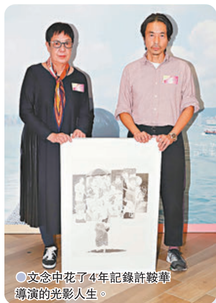
●文念中花了4年記錄許鞍華導演的光影人生。

此外，金球獎入圍名單近日揭曉，今年就創紀錄有3位女導演入圍，分別是《浪跡天地》華裔女導演趙婷、《邁阿密的一夜》雷珍娜京(Régina King)及《超犀女王》艾美露芬奈爾(Emerald Fennell)。