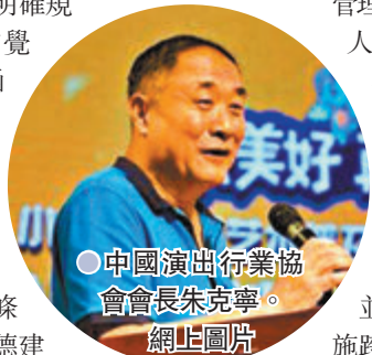
●中國演出行業協會會長朱克寧。

管理辦法規定，根據演藝人員違反從業規範情節輕重及危害程度，協會將監督引導會員單位在行業範圍內分別實施1年、3年、5年和永久等不同程度的行業聯合抵制，並協同其他行業組織實施跨行業聯合懲戒。管理辦法規定，受到聯合抵制的演藝人員需要繼續從事演出活動的，藝人或者其所屬單位應當在聯合抵制期限屆滿前3個月內向道德建設委員會提出申請，經道德建設委員會綜合評議後，給予是否同意復出的意見。對符合復出條件的演藝人員，由中國演出行業協會向會員單位和個人通報，取消聯合抵制措施，並監督引導其參與行業培訓、職業教育、公益項目等活動，改善社會形象。