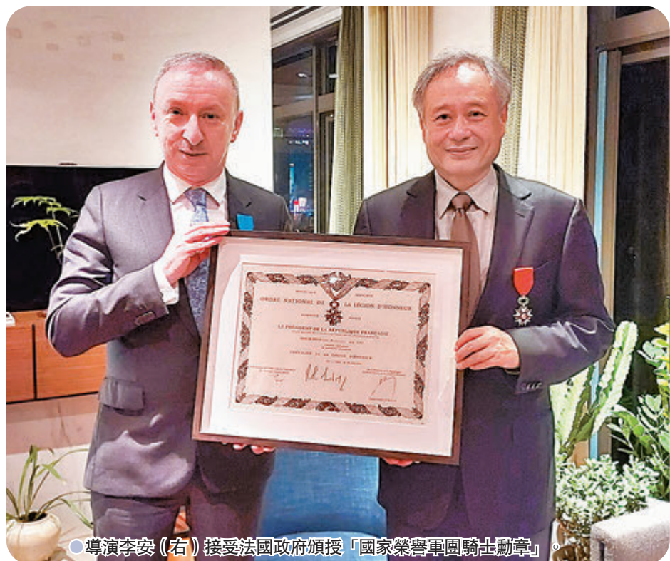
●導演李安(右)接受法國政府頒授「國家榮譽軍團騎士勳章」。