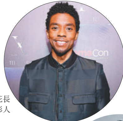
●已故「黑豹」有望問鼎奧斯卡殊榮。

香港文匯報訊(記者 文芬)台灣導演李安日前獲法國頒授「國家榮譽軍團騎士勳章」，以表彰他在電影文化的傑出成就。另外，第16屆大阪亞洲電影節(Osaka Asian Film Festival 2020)昨日公布，由文念中執導的電影《好好拍電影》獲選為開幕電影，為港爭光。