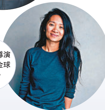
●華裔女導演趙婷角逐金球最佳導演。

此外，金球獎入圍名單近日揭曉，今年就創紀錄有3位女導演入圍，分別是《浪跡天地》華裔女導演趙婷、《邁阿密的一夜》雷珍娜京(Régina King)及《超犀女王》艾美露芬奈爾(Emerald Fennell)。