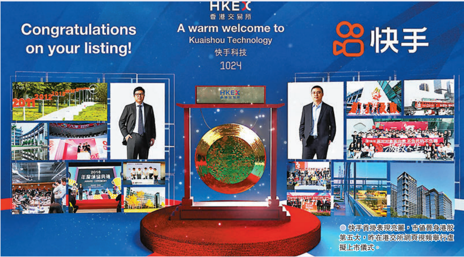
● 快手首掛表現亮麗，市值晉身港股第五大，昨在港交所網頁視頻舉行虛擬上市儀式。

市場昨日焦點盡在首日隆重登場的「新股王」快手(1024)，該股果不負眾望，收升1.6倍，一手賬面賺達1.85萬元，是今年首日掛牌回報最好的新股。以收市價計，快手的市值達1.23萬億元，超越友邦(1299)成為本港市值第五大股份。雖然快手昨日交投非常熱絡，成交高達375.5億元，居成交額榜首，佔全日大市成交額約15.7%，成交量1.2億股，相當是次全球總發行股數的三分之一，但估計向隅者仍眾，股民都心大心細，想了解是否值得追入。