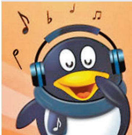
● 市傳騰訊旗下騰訊音樂有望於年內回流香港作第二上市。

香港文匯報訊(記者 岑健樂) TMT(科技、媒體和通信)股IPO熱潮持續，繼騰訊(0700)投資的快手科技(1024)昨日