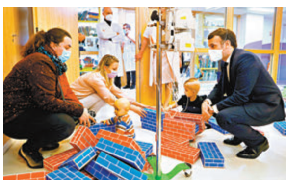
●馬克龍一直強調要與中國打交道。圖為他參觀醫療設施。

法國總統馬克龍前日在美國智庫「大西洋理事會」網上研討會上表示，即使歐盟因共同價值觀與美國走得更近，也不應與美國「拉幫結派」圍堵中國，否則極可能引發衝突，結果將適得其反。