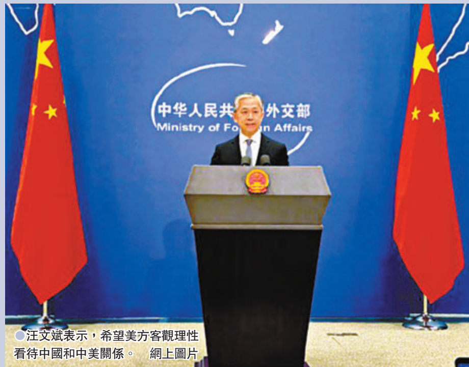
●汪文斌表示，希望美方客觀理性看待中國和中美關係。網上圖片