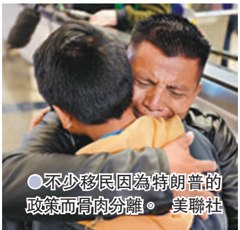
●不少移民因為特朗普的政策而骨肉分離。

年10月開始將每年難民名額增至12.5萬人，較前總統奧巴馬時期還多出1.5萬人。拜登承諾放寬無證移民計劃以來，吸引大批中、美、非、法移民湧至美墨邊境，關注難民權益人士則認為，拜登此項新政策有助加快處理難民申請。