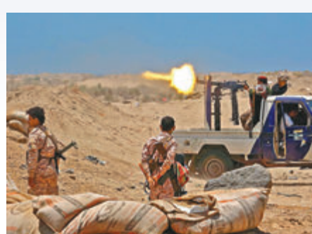
●也門內戰導致逾10萬人喪生。

美國總統拜登前日在外交政策演說中，推翻前總統特朗普的政策，宣布美國停止支援沙特阿拉伯在也門的軍事行動，不再向沙特出售武器，認為需要結束這場災難性的戰爭。拜登同時叫停撤走駐德美國軍的計劃。