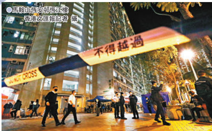
馬鞍山恆安邨恆江樓