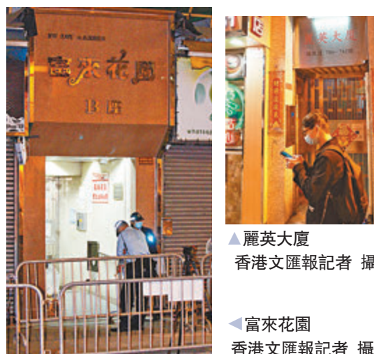
麗英大廈