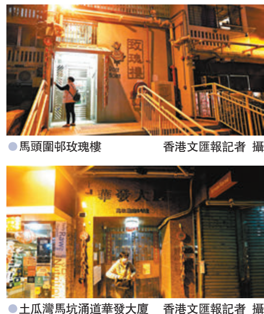
馬頭圍邨玫瑰樓

衛生防護中心傳染病處主任張竹君昨日表示，油麻地「受限區域」強制檢測中一名居民體內驗出抗體，懷疑初步確診，後經核實該人早前染疫，經治療康復出院，故快速檢測發現有抗體。另一「受限區域」旺角文華閣則有3名密切接觸者被送往檢疫中心，涉及該大樓早前確診的一宗個案。