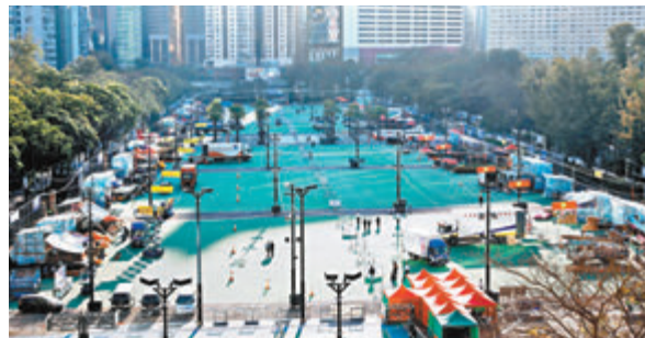
維園年宵花檔大減一半，均設於球場兩邊。

香港文匯報訊(記者 文森)維園年宵市場今日開鑼。鑑於疫情持續，場內攤位大減一半，只餘球場兩邊擺滿檔口，中間變成闊寬的行人大道。有檔主直言，入場設多重防疫措施並縮短營業時間，加上疫情未有明顯減緩，相信生意較往年差。