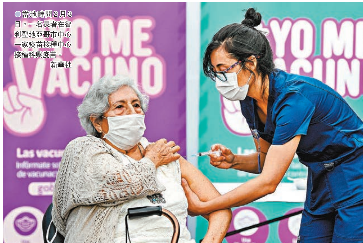
●當地時間2月3日，一名長者在智利聖地亞哥市中心一家疫苗接種中心接種科興疫苗。

面對新冠肺炎，老年人群具有更高的發病率和死亡率，因此迫切需要針對老年人的新冠疫苗。上述論文評估了克爾來福疫苗在 60 歲及以上成年人中的安全性、耐受性和免疫原性。科研人員在中國河北省任丘市 60 歲及以上的健康成年人中進行了對於克爾來福的隨機、雙盲、安慰劑對照的 I/II 期臨床試驗。