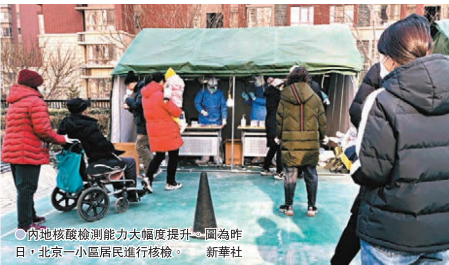
●內地核酸檢測能力大幅度提升。圖為昨日，北京一小區居民進行核檢。

預防控制中心、武漢市疾病預防控制中心、湖北省動物疫病預防控制中心、中科院武漢病毒所等機構，同相關管理人員、專家、商戶、居民、媒體代表等進行了交流，並與武漢市血液中心、華中農業大學等機構專家進行了座談。