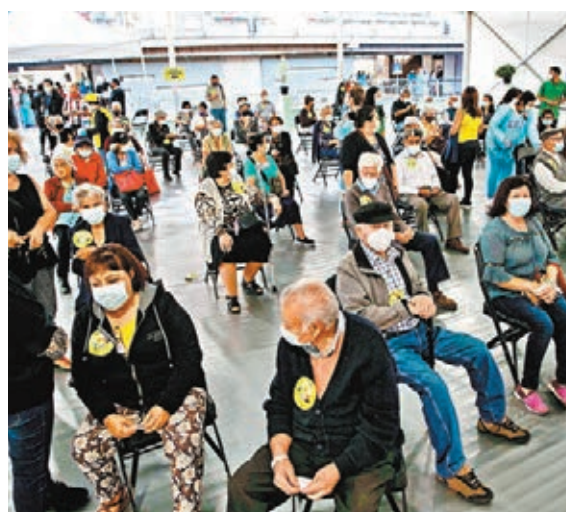
●等待接種科興疫苗的智利長者人數眾多。圖為當地時間3日，長者們在接種點排隊等候。