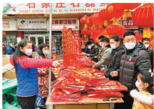
●石家莊南三條市場又繁忙了起來。