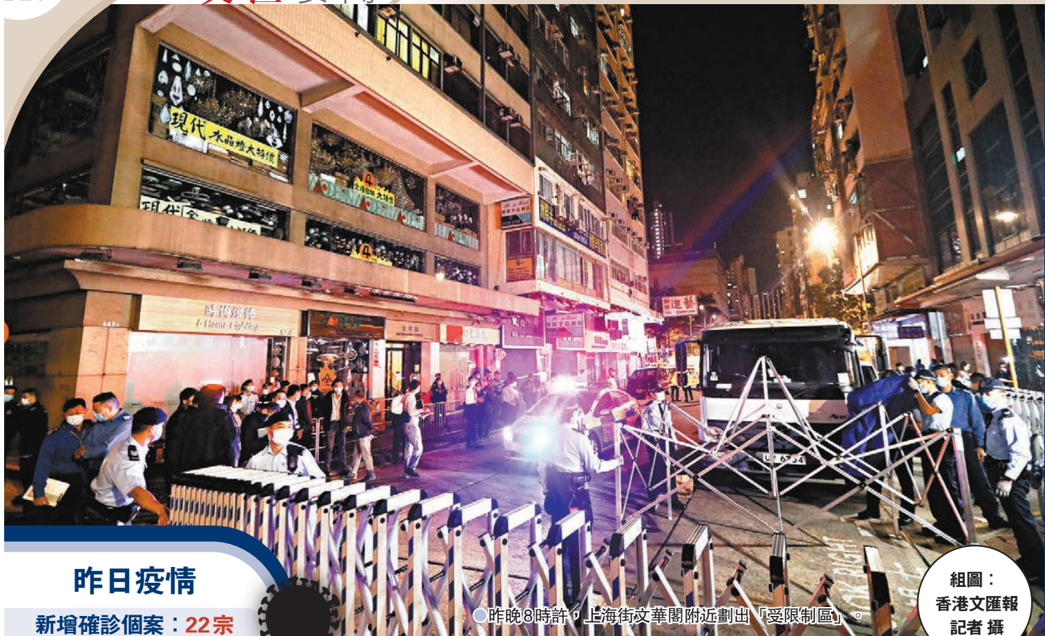
昨晚8時許，上海街文華閣附近劃出「受限區域」。