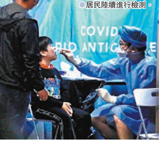
居民陸續進行檢測。

香港文匯報訊(記者 文森)香港新冠肺炎疫情持續，特區政府昨日突擊將油麻地碧街、東安街、登打士街及廣東道內的多幢大廈；以及旺角上海街文華閣列為「受限區域」，是連續第五天突擊封區。翻查資料，今次「受限區域」中的碧街是第二次被封，上一次為1月26日。整個油麻地「受限區域」過去兩周共累積31宗確診個案。 政府昨日連續第五天突擊封區，油麻地再成重災區，包括碧街7A號至27A號、東安街2號至50號、廣東道833號至889號及登打士街10號至16號，均在昨晚7時被納入「受限區域」。昨晚8時，政府圍封旺角上海街647號至651號文華閣，所有居民都需要禁足接受強制檢測，預計今晨7時完成。