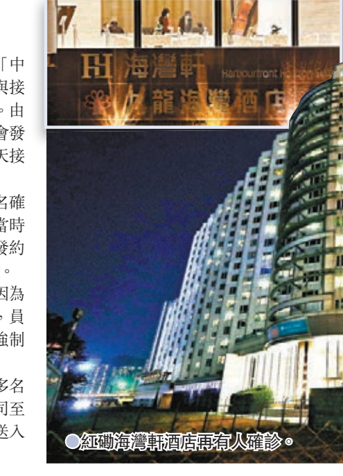
紅磡海灣軒酒店再有人確診。