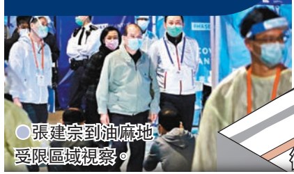
張建宗到油麻地受限區域視察。