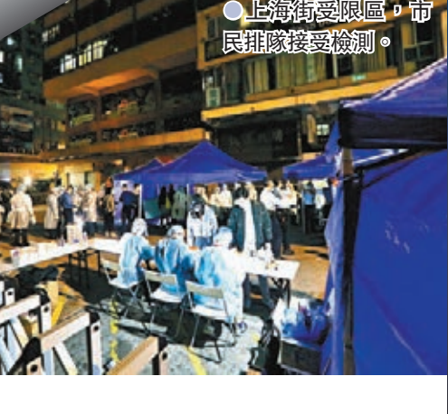
上海街受限區，市民排隊接受檢測。

歐家榮指，該酒店之前有一名外判維修員「中招」(個案10207)，上月25日最後一天上班，與接待員無密切接觸，可能在共用環境有隱性傳播。由於近日酒店已有兩名員工確診，衛生防護中心會發出強制檢測令，要求酒店所有員工於今、明兩天接受病毒檢測，涉及逾200名員工。 至於早前酒店的保安群組，歐家榮表示，6名確診保安員的發病時間介乎1月16日至20日，當時有80多名保安員被送往檢疫，中心其後派發約2,000個樣本予酒店住客及員工，全部呈陰性。他認為住客風險相對較低但未能完全排除，因為暫時染疫者都是員工，而且酒店屬住宅式服務，員工跟住客接觸較少並都有戴口罩，中心會視乎強制檢測結果再決定後續行動。 早前有消息指中環太子大廈一間窗頭公司有多名員工確診，歐家榮昨日確認事件，並表示該公司至今有4人確診，因為公司員工不多，現已全部送入檢疫中心。