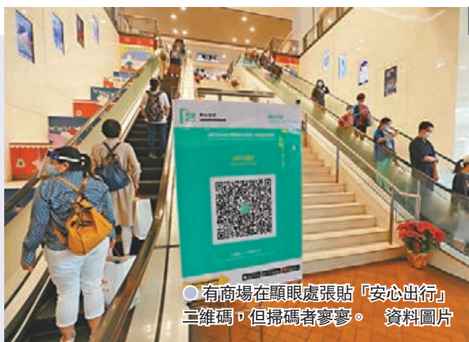
●有商場在顯眼處張貼「安心出行」二維碼，但掃碼者寥寥。資料圖片