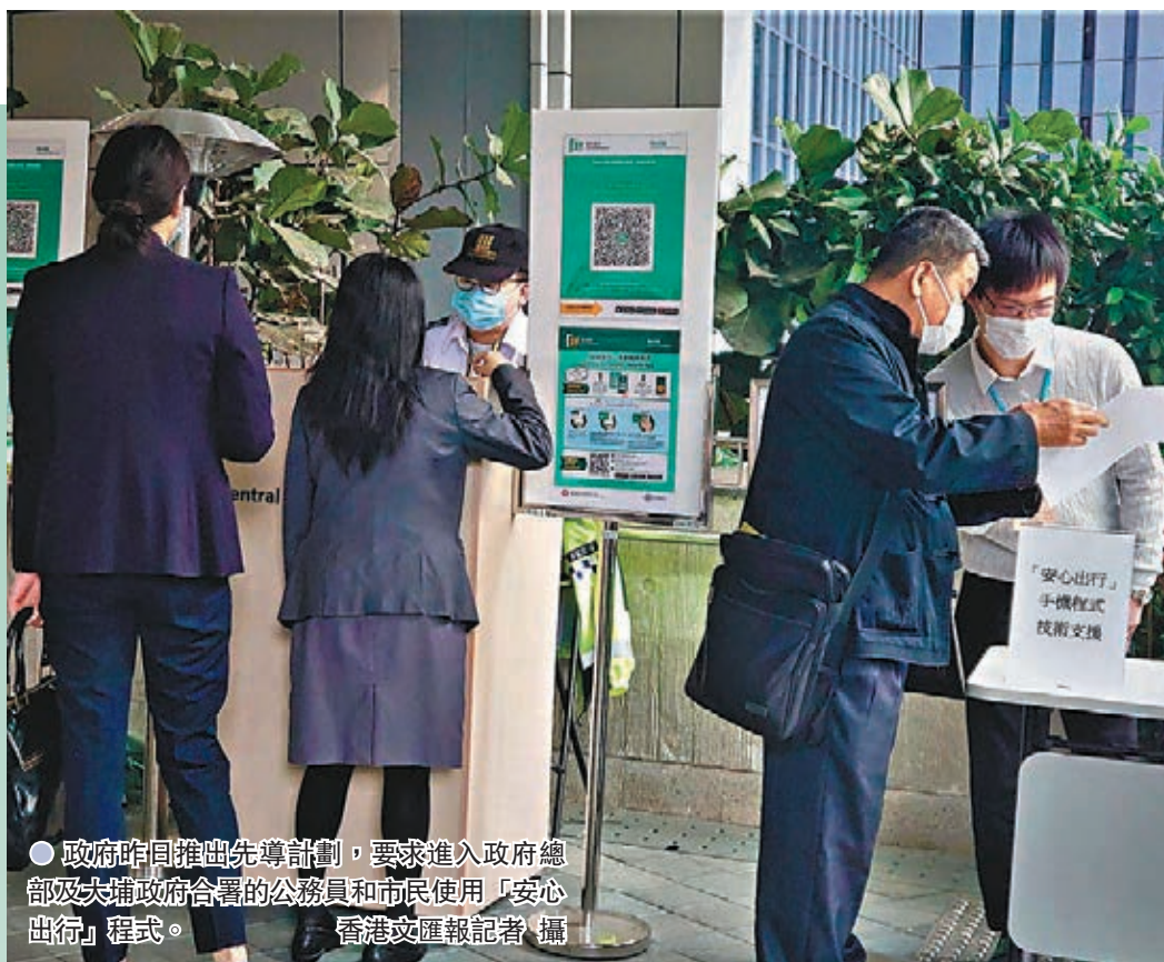
●政府昨日推出先導計劃，要求進入政府總部及大埔政府合署的公務員和市民使用「安心出行」程式。

不少市民質疑使用「安心出行」程式會洩露私隱，葛珮帆表示，政府根本不會有市民的行蹤記錄，但認為就算政府加入追蹤功能，在現時疫情橫行、人命攸關之際，作出一點私隱的犧牲也屬可以接受，建議政府應多向市民詳細解釋程式的效用，以消除疑慮，增加市民使用的意慾。