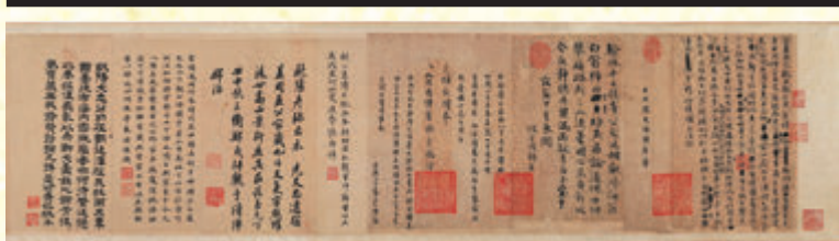
●北宋歐陽修行書譜圖序稿並詩卷(部分)。 (遼博文物圖)