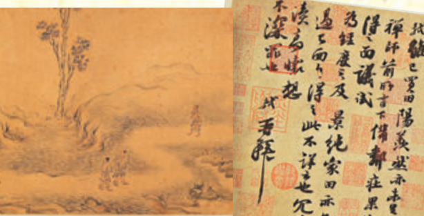
●北宋蘇軾行書襄陽帖。 (遼博文物圖)