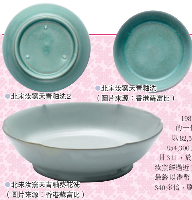
●北宋汝窯天青釉洗 ●北宋汝窯天青釉洗2 ●北宋汝窯天青釉洗 (圖片來源：香港蘇富比) ●北宋汝窯天青釉葵花洗 (圖片來源：香港蘇富比)