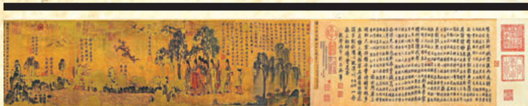
●洛神賦圖(部分)。(遼博文物圖)