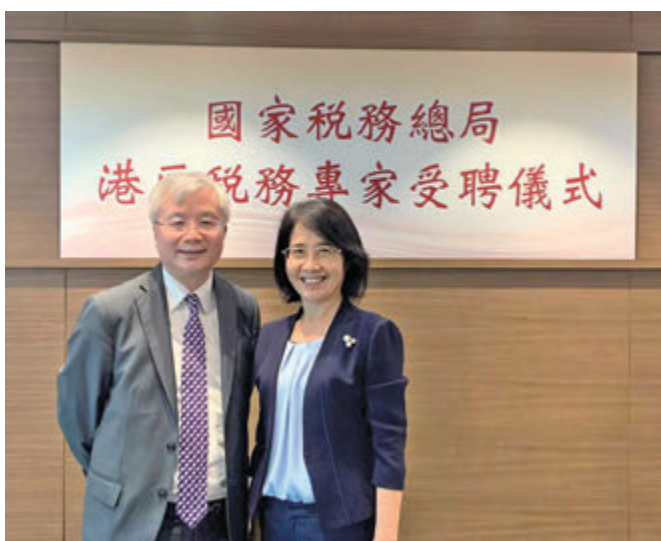
●2020年7月14日，龔永德獲國家稅務總局聘為港區稅務專家。