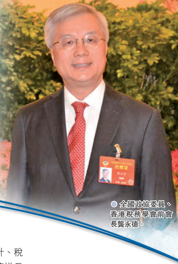
●全國政協委員、香港稅務學會前會長龔永德。

全國政協委員、香港稅務學會前會長龔永德擁有超過30年的專業經驗，專注於中國會計、稅務領域，積極參與粵港澳大灣區發展的諮詢工作。是次，他以切身經驗從市場需求、經濟增長率等，深度剖析拓展大灣區市場為香港帶來的新發展機遇，並就把握香港優勢提出獨到見解。