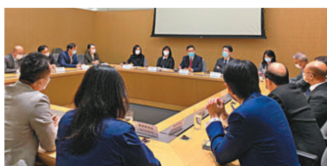
●教育局前日與學校議會及校長會代表會面，了解教界對恢復面授的意見。

教育局提醒，在全校未恢復面授課堂及校內活動之前，應彈性運用不同的教學模式教學，讓學生持續在家學習；學校須如常保持校舍開放，並安排教職員當值，以便照顧家中缺乏人照顧的學生。