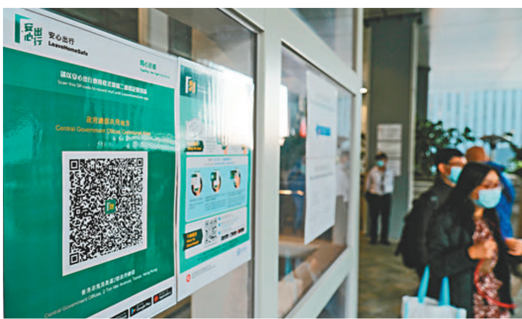
●香港政府總部出入口增貼大量「安心出行」二維碼。