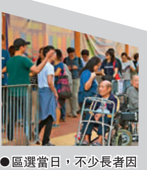
●區選當日，不少長者因受阻未有投票。資料圖片