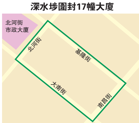
深水埗圍封17幢大廈