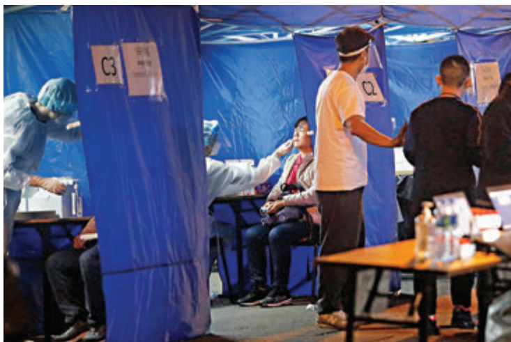
●深水埗受限區域的居民在接受採樣。

另外，佐敦「受限區域」涉及彌敦道、長樂街至志和街一帶，警方於昨晚7時許將該區圍封，有身穿全套保護衣的人員進駐，曾有居民下樓查詢，經執法人員勸喻後返回單位。翻查資料，佐敦「受限區域」內的長樂街24號在過去14天出現3宗確診個案，全屬機場三跑群組。