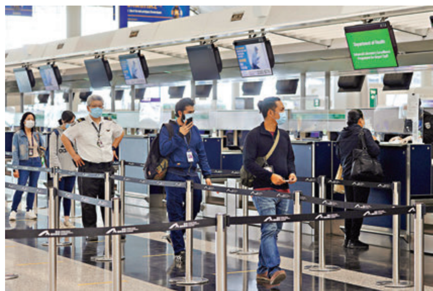
●香港機場員工排隊領取檢測試劑包。

局各個聯網已經合共抽調15名醫生及40名護士到該中心24小時輪班工作，他們主要是來自急症或內科部門。