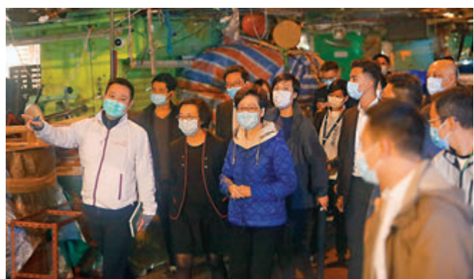
●特首林鄭月娥等官員視察深水埗受限區域強檢進展。

深水埗「受限區域」涉及大量唐樓。政府發言人解釋，該處大廈的污水對新冠病毒呈陽性。