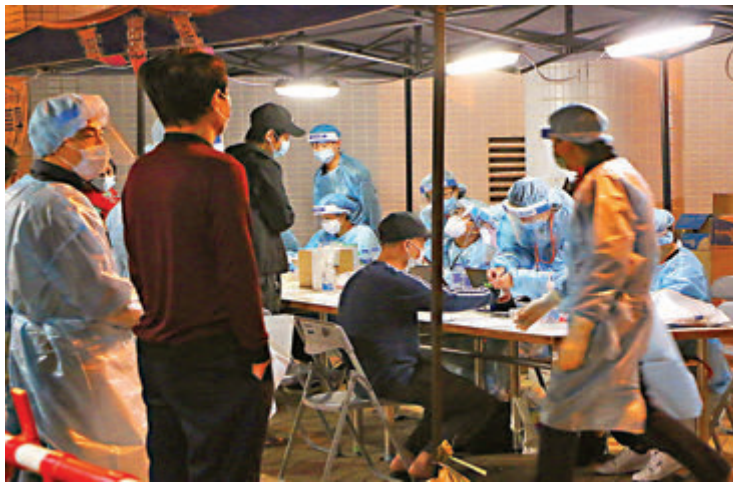
●檢疫人員為採樣的天恒邨恒樂樓居民綁上手帶。