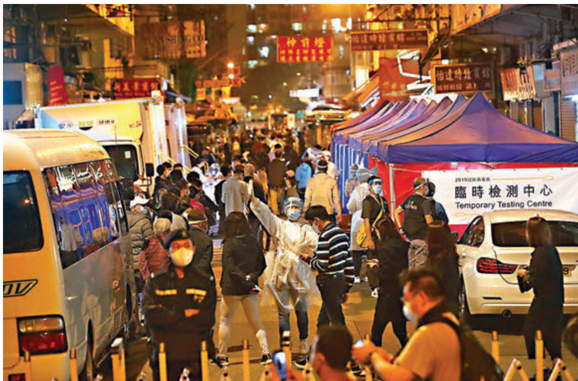
●深水埗北河街、基隆街、南昌街、大南街連成的受限區域內的居民連夜排隊採樣。