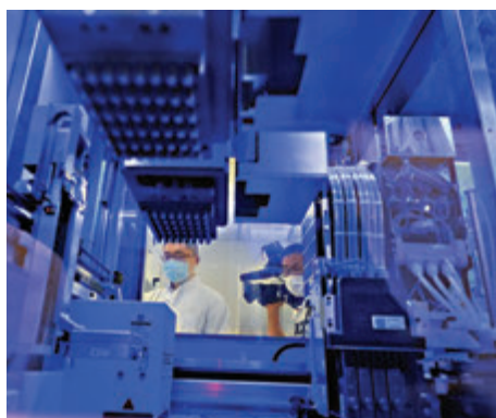
●感染控制中心內的檢測儀器。

區治療中心及感染控制中心的病人，初步考慮亦會化驗醫管局普通科門診收集到的樣本瓶。為了防止交叉感染，中心與旁邊的社區治療設施的醫護人員會盡可能分成兩組，但指如果有病人情況惡化需醫護人員陪同轉院令設施內人手突然變得緊張，兩個設施內的醫護人手亦可即時靈活調動。 中心亦有一座設有化驗室及藥劑部等設施的醫療中心，黃立已指化驗室內有兩部大型檢測儀器，在本月17日開始運作後會為入院病人及普通科門診收到的樣本進行化驗，首階段每日運作8小時可以處理約1,500個樣本，令公立醫院的檢測能力提升10%至15%，如果日後有需要全日運作，檢測量更可多達4,000個。 據悉，為了配合中心首階段運作，醫管