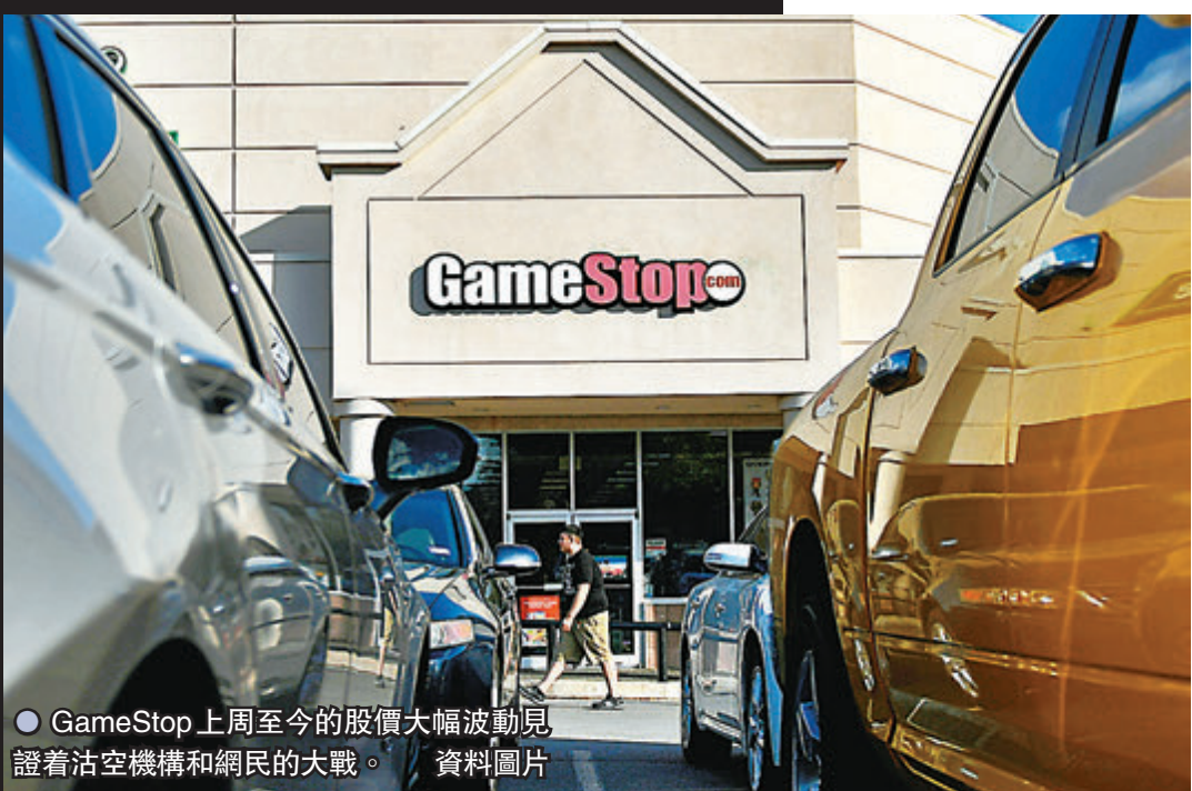
● GameStop 上周至今的股價大幅波動見證着沽空機構和網民的大戰。