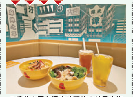
●香茜皮蛋魚湯米線配脆肉皖及泡椒酸菜魚湯米線配脆肉皖