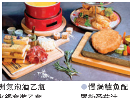
●送澳洲氣泡酒乙瓶及芝士火鍋裝乙套 ●慢焗鱈魚配羅勒番茄汁

絲芝士，口感出色滿有驚喜。豐富配料有丹麥多士、中式炸油條、意大利沙樂美腸、意大利雲吞、金香雞腿、煙肉帶子卷，以及新鮮生果和薯粒等。主菜方面，當然不能錯過肉量十足的「美國頂級肉眼牛扒配粉紅胡椒汁」或較輕盈的「慢焗鱈魚配羅勒番茄汁」，用料和烹煮方法更是十分吸引，適合情侶們度過愜意綿綿的一晚。