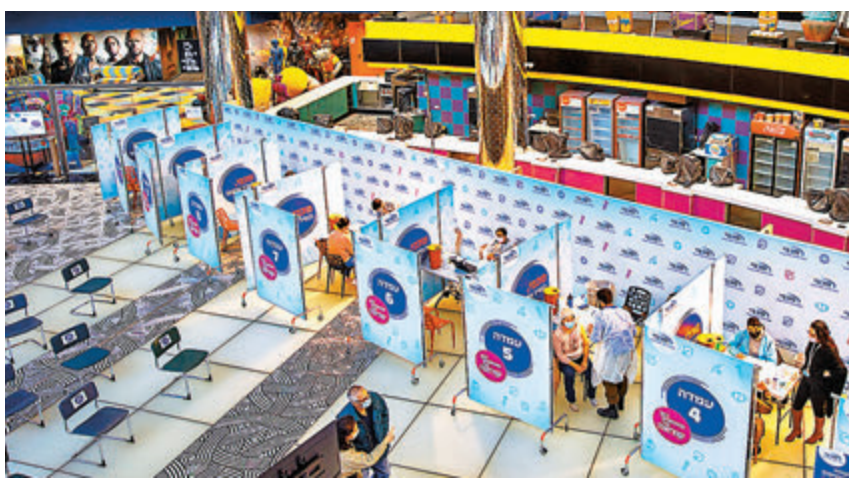
●以色列目前已有1/3人口接種首劑新冠疫苗。