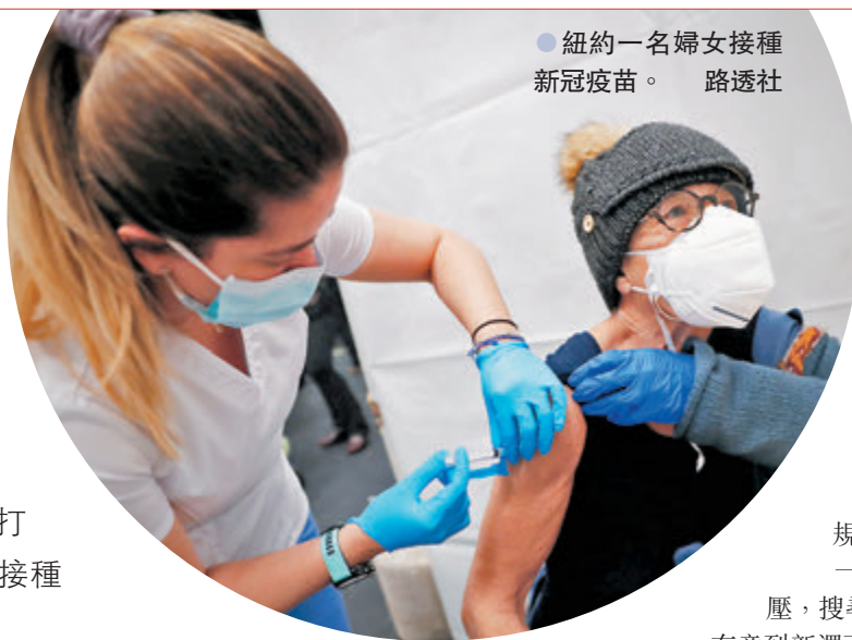
●紐約一名婦女接種新冠疫苗。

美國已經展開新冠疫苗接種一個多月，然而打針計劃是由各州政府自行制定，有其他州份、以至外國居民看準部分州份打針準則較寬鬆，穿州過省為求取得疫苗，「疫苗旅遊」應運而生。醫學界擔心經濟能力較高的人士借漏洞插隊打針，做法不單不公平，亦恐打亂各州接種計劃，妨礙抗疫。