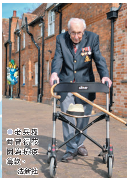
●老兵穆爾曾行花園為抗疫籌款。