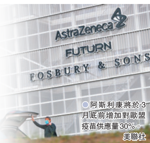
●阿斯利康將於3月底前增加對歐盟疫苗供應量30%。