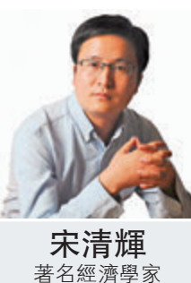
宋清輝 著名經濟學家

近年來，內地對資本市場的重視可謂前所未有。例如2020年3月開始實施的新證券法，以及2021年3月正式實施的《刑法修正案（十一）》都加大了證券市場違法違規的懲罰力度。內地監管層對證券市場的監管趨嚴，意味着法治建設的進一步深化，任何一個行業、產業、事業都沒有法外之地，這既是國家對金融系統、資本市場的重視，也是內地全面依法治國的重要體現。