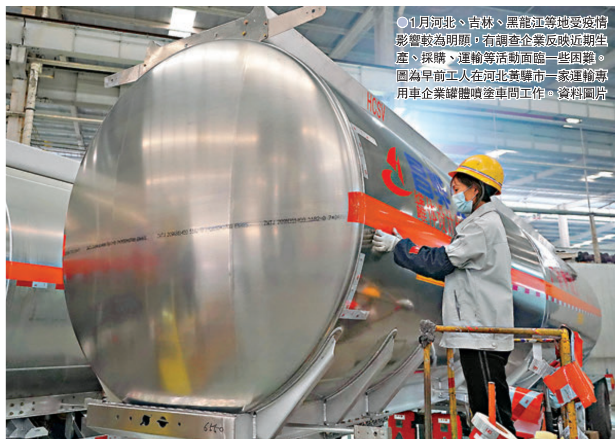
1月河北、吉林、黑龍江等地受疫情影響較為明顯，有調查企業反映近期生產、採購、運輸等活動面臨一些困難。圖為早前工人在河北黃驊市一家運輸專用車企業罐體噴塗車間工作。資料圖片

國家統計局服務業調查中心高級統計師趙慶河表示，1月河北、吉林、黑龍江等地受疫情影響較為明顯，有調查企業反映近期生產、採購、運輸等活動面臨一些困難。還有調查企業反映，疫情影響員工正常到崗，加之部分人員提前返鄉，企業用工缺口加大；同時，有些地區物流放緩，部分企業產品外銷與原材料購進活動受到影響。 與此同時，進出口景氣度有所回落。趙慶河認為，前期聖誕季海外需求集中釋放，疊加全球疫情持續蔓延等因素，部分企業外貿訂單有所減少，但農副食品加工、計算機通信電子設備及儀器儀表等行業新出口訂單指數和進口指數均位於51%以上，反映這些行業外貿業務有所增加。 疫情反彈和防控升溫也影響到服務業，國家統計局數據顯示，1月非製造業商務活動指數（服務業PMI）為52.4%，環比下降3.3個百分點，為2020年4月以來最低。 聚集性消費行業指數回落明顯 趙慶河援引調查結果稱，1月住宿、餐飲、文化體育娛樂、居民服務等接觸式、聚集性消費行業商務活動指數回落幅度較為明顯，均位於收縮區間。此外，近