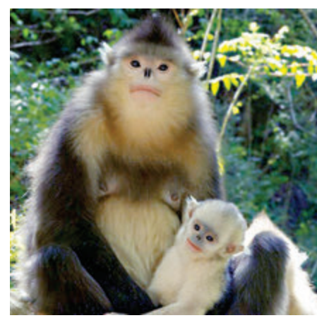
《美麗中國說》採用講故事的形式全景式地記錄了金絲猴等秦嶺地區珍稀動物的野外生活。網上圖片

香港文匯報訊 中央廣播電視總台首部全流程8K紀錄片《美麗中國說》已經攝製完成，該片在8K技術應用上取得跨越性突破，開創了總台8K紀錄片自主製作的先河。《美麗中國說》紀錄片由總台英語環球節目中心和技術局共同攝製完成。全片共5集，每集30分鐘，製作周期歷時近一年，前後嚴格參照總台8K製作標準，利用創新超高清8K視頻技術和三維聲音頻技術，打造了更高品質完美展現真實場景的視聽體驗。 《美麗中國說》節目內容以陝西秦嶺、雲南西雙版納和迪慶、吉林長白山、江蘇鹽城等不同主題、各具特色的地區為主要拍攝區域，通過長期野外蹲守、跟蹤拍攝，獲得大量珍貴畫面，採用講故事的形式全景式地記錄了金絲猴、羚牛等秦嶺地區珍稀動物的野外生活，雨林王者亞洲象群的家族遷徙和生存故事，中華秋沙鴨孵化破殼到振翅出巢的艱辛歷程，滇金絲猴成長過程和生活習性，鹽城濕地麋鹿爭霸的殊死搏殺等珍貴影像。 該紀錄片堅持用敬畏的眼光禮讚自然、用平等的視角親近生物，用真實的鏡頭記錄中國各地的生態環境，揭示人與自然和諧相處、命運與共的理念，以獨特的視角呈現了不一樣的中國生態文明觀。