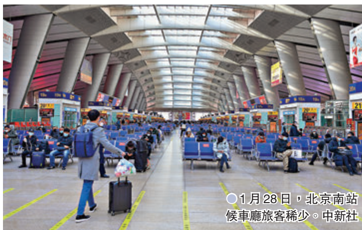
1月28日，北京南站候車廳旅客稀少。

項疫情防控措施不放鬆，努力確保旅客走得安全放心。」國鐵集團相關負責人表示，在進站乘車環節，會充分發揮電子客票全覆蓋的優勢，引導絕大多數旅客使用自助開機「一證通行」。在乘車過程中，列車員將勸導旅客盡量減少車廂內走動、推薦旅客使用掃碼點餐、互聯網訂餐。 官方：防控不得一刀切 另據中通社報道，中國國家衛健委發言人米鋒在1月31日的新聞發布會上表示，近日有一些地方出現了對返鄉人員健康監測和核酸等層層加碼、一刀切，引發了全社會的普遍關注。國家在總結前一階段經驗教訓的基礎上，依法制定春運期間的疫情防控政策，也是為了盡可能降低疫情擴散的風險，絕不是要給春節團聚設置超出防控需要的障礙。層層加碼和一刀切既是一種懶政，也是對寶貴