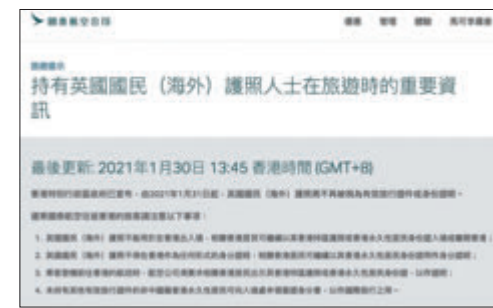
●國泰航空在網頁提醒旅客新措施安排。

之前，提供另一本有效護照的資料；如果沒有，應該盡快申請特區護照。至於乘搭飛機回港的香港居民，入境處指，航空公司須要求他們出示特區護照或永久性居民身份證作證明才可登機。