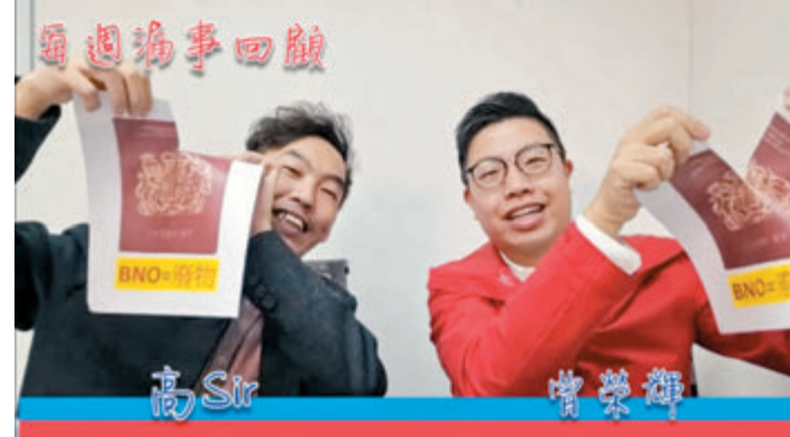
▲一班愛國愛港青年網紅昨日在直播節目中接力撕掉BNO，警告英國政府勿再干預中國內政。