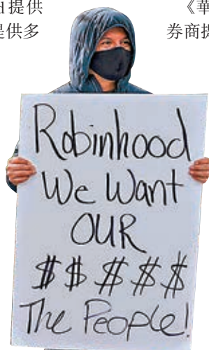
●示威者對 Robinhood 的做法表示不滿。