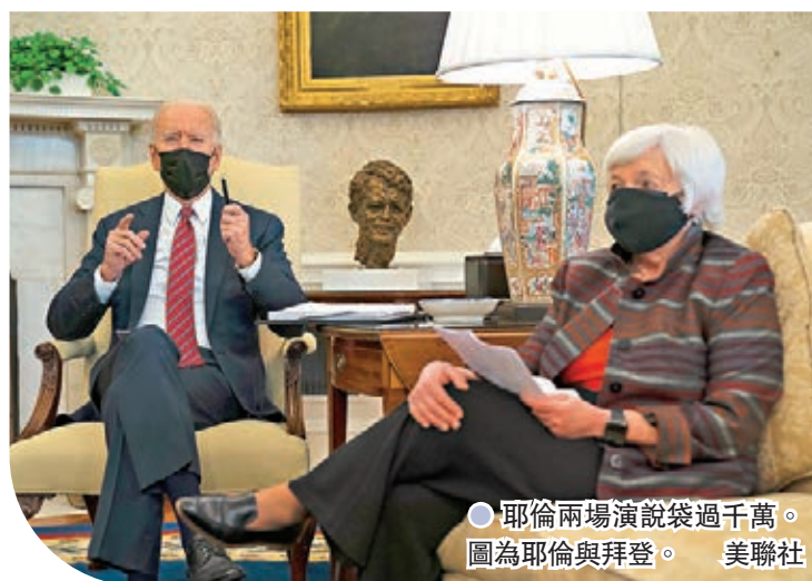
●耶倫兩場演說袋過千萬。圖為耶倫與拜登。

美國大型金融服務公司 Citadel 除了游說政客外，亦在政壇積極建立人脈關係，例如在 2019 年至 2020 年間，便分別給予前聯儲局主席耶倫 71 萬美元（約 548 萬港元）和 76 萬美元（約 586 萬港元）演說酬勞。如今耶倫身為總統拜登政府的財長，引起外界關注利益輸送嫌疑。