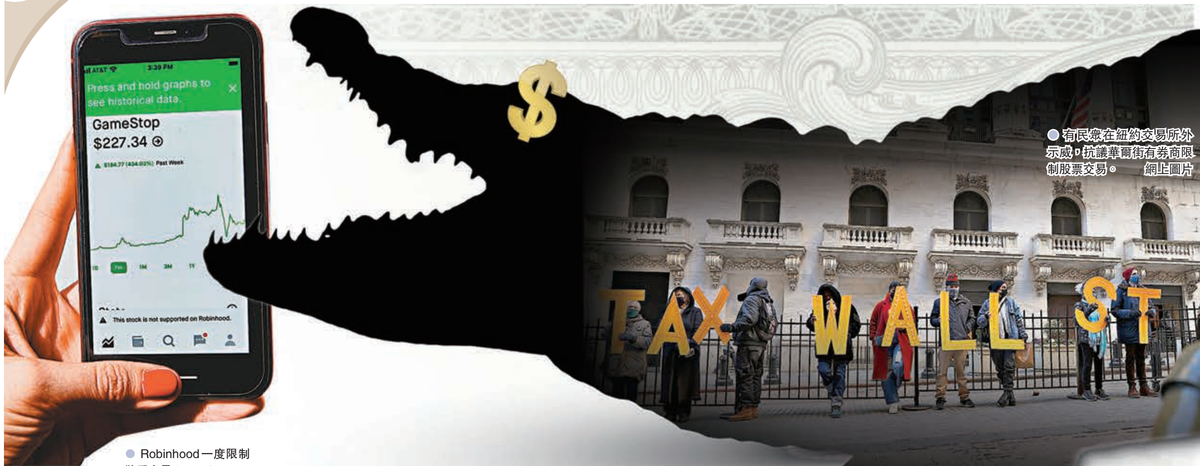
●有民衆在紐約交易所外示威，抗議華爾街有券商限制股票交易。