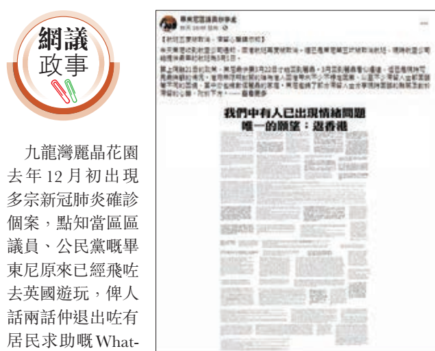
舉東尼fb發帖扮「滯留人士」博同情，被網民鬧爆。fb截圖

「Raymond To」直言「比起來，香港7百萬人的健康還是更加重要。前幾天新聞報道說一位澳門居民從英國轉了多次機，終於回到澳門，檢測後結果是陽性！還是乖乖的留在英國算了，真的冇嚴重的事情，可以聯繫我們國家的大使館啊！」