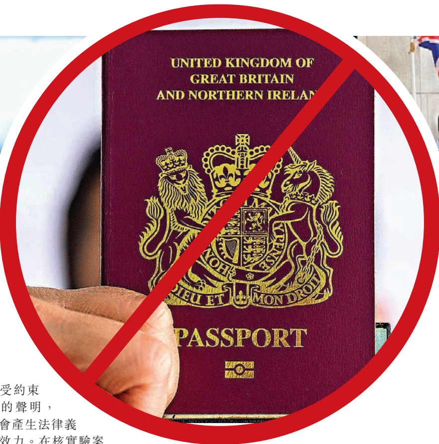
▲BNO今起不能用於在香港出入境。資料圖片