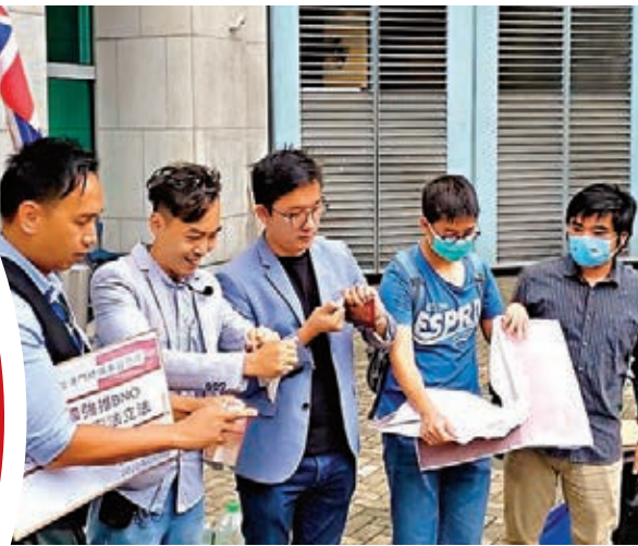
●外交部宣布不再承認所謂BNO護照作為有效旅行證件和身份證明。圖為早前多名青年撕毀BNO護照，抗議英國干政。資料圖片

鄭若驊昨日發表網誌《正確理解〈中英聯合聲明〉和英方備忘錄》。她指出，大家只要正確理解《中英聯合聲明》，就會明白其中並無任何條款讓英方在香港回歸祖國後承擔任何權責，並引述了外交部駐香港特區前特派員謝鋒在一次演講中的說明：「所有因《聯合聲明》而產生的在英國和香港之間的法律聯繫，最遲在中英聯合聯絡小組2000年1月1日終止工作時已結束。英國無權再根據《聯合聲明》對香港提出新的權利和責任主張。簡而言之，對於回歸後的香港，英國無主權、無管轄權，亦無「監督」權。」 她表示，《聯合聲明》的簽署，標誌着香港問題終於獲得解決，樹立了和平解決歷史問題的典範，奠定中華民族統一大業的堅實基礎。在簽署