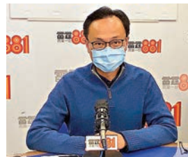
●聶德權預料下月內收齊公務員已簽署的聲明。

香港文匯報訊（記者 倪思言）公務員事務局局長聶德權昨日接受電台訪問時表示，預料下月內會收齊公務員已簽署的聲明，拒簽的人員將會按機制處理，並按個案及公務人員管理命令安排離職。至於公務員是否要放棄持有BNO護照，聶德權指，公務員擁有國籍安排根據基本法與香港法例現有規定進行，不應將兩個問題混為一談。 倘拒簽聲明或安排離職 公務員事務局早前已向政府各部門發出通告，要求於2020年7月1日前受聘的公務員宣誓或簽署聲明，承諾擁護基本法並效忠香港特區，除部門首長級須宣誓外，其餘的公務員須在4周內簽妥及交回聲明。 聶德權表示，已將所有相關文件發送予現職同事，預料在下月內會收齊已簽署聲明。他強調，簽署聲明是確認公務員的基本責任，當局會嚴重質疑拒簽人員是拒絕承擔責任。他們須在短時間內回覆拒簽原因。其後會再按機制處理，並會根據個案及公務人員管理命令處理離職安排。 被問到國家主席習近平早前聽取行政長官林鄭月娥述職時談到「愛國者治港」，聶德權表示，愛國者即是要擁護基本法、接受香港憲法秩序。他說，香港作為中國一部分，應落實「一國兩制」，維護國家領土完整及維持香港繁榮穩定，而公務員團隊作為政治體制中的一部分，亦有同樣要求。 至於公務員是否需要放棄持有BNO護照，聶德權說，外交部已就BNO護照問題發出清晰訊息，特區政府亦已表示BNO不能再作為旅遊證件及身份證明。至於公務員擁有國籍的安排，是根據基本法及香港法例現有規定進行的，不應將兩件事混為一談。