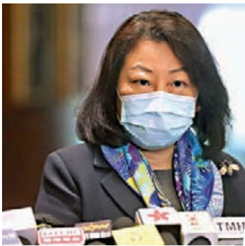
●鄭若驊指在《中英聯合聲明》中，並無條款讓英方在香港回歸祖國後承擔任何權責。