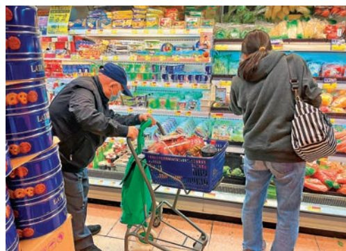
●紅磡區疫情持續，居民掃貨儲糧準備隨時配合政府的封區行動。