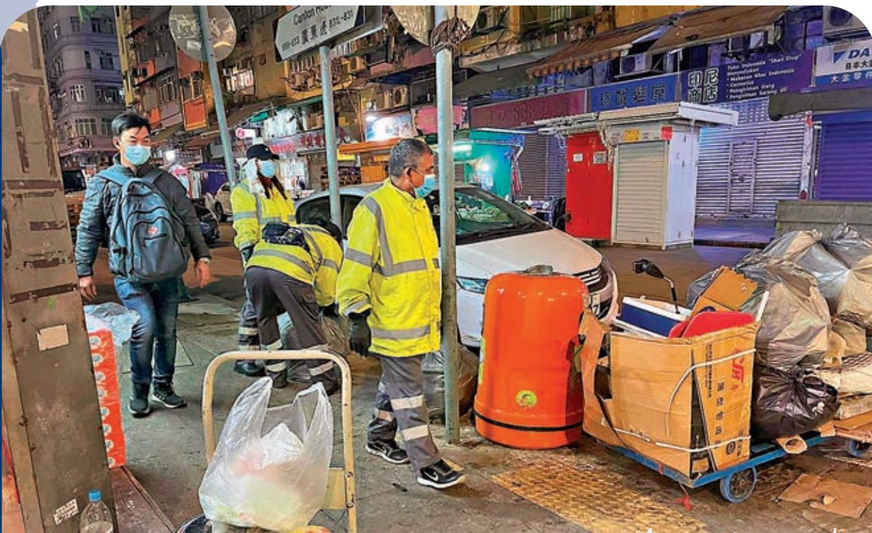
●曾被圍封的旺角碧街，昨晚有工人加強街道清潔。