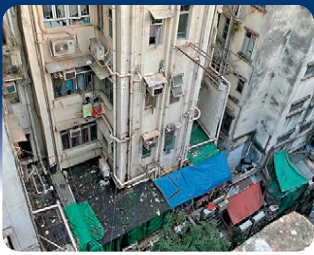
●佐敦舊廈喉管錯亂，衛生差劣。