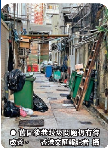
●舊區後巷垃圾問題仍有待改善。