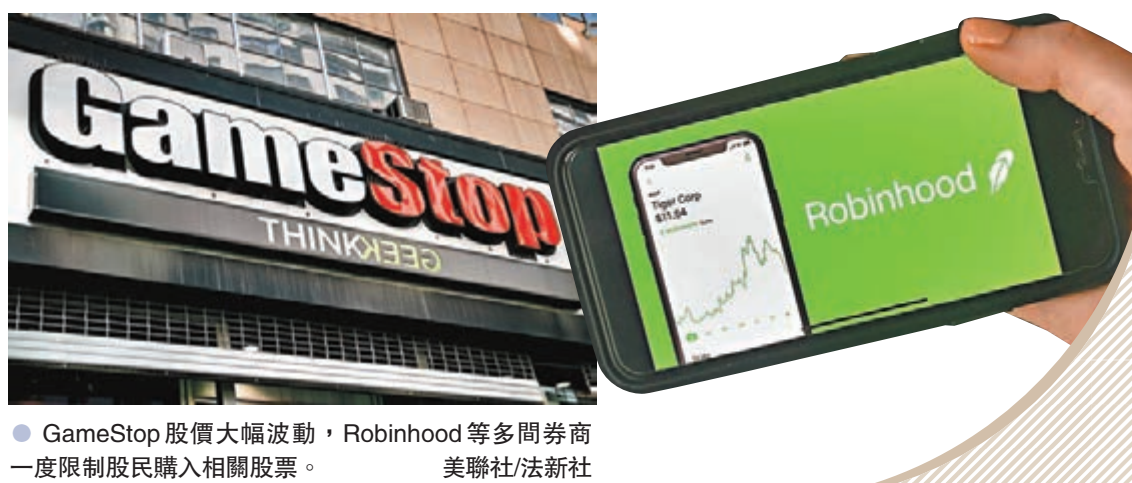
● GameStop 股價大幅波動，Robinhood 等多間券商一度限制散戶購入相關股票。 ●綜合報道 美聯社/法新社

美國散戶今次群起針對沽空機構，掀起一場散戶與大戶的對決。前總統特朗普兒子小特朗普前日就這場風波開腔，稱科企、政府和傳媒急不及待包庇他們的「華爾街老友」，又形容這是一個受操控的制度。但事實上，美國政府近年未有嚴格監管金融大鱷，放任他們在市場興風作浪，早已備受詬病，特朗普任內更放寬金融監管，令不少大戶可以操控市場圖利，更是責無旁貸。(尚有相關新聞刊 B1) ●綜合報道