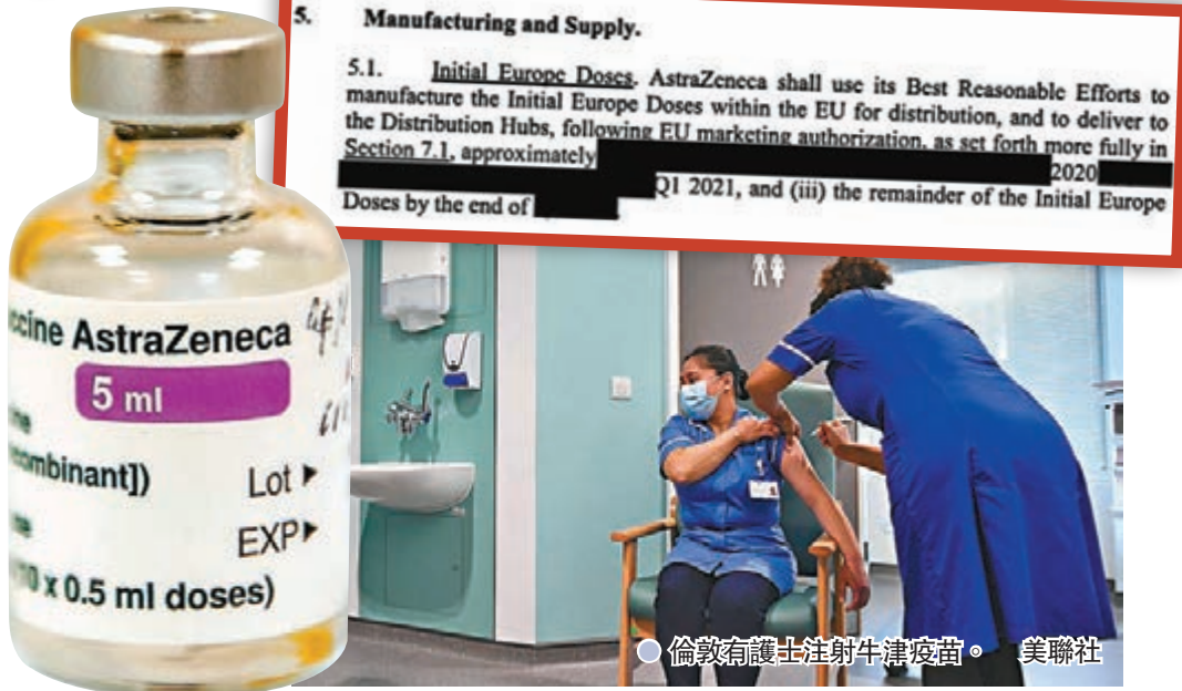
● 倫敦有護士注射牛津疫苗。