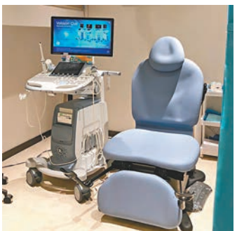
●超聲波儀器。

不過並不是所有的乳房腫塊都需要切除，如果發現是水囊或者良性的纖維瘤可以繼續觀察。大部分的乳房腫塊是良性的，所以摸到乳房腫塊不需要太過擔心，兵來將擋，現在的科學很先進，可以用不同的方法去醫治不同的情況。