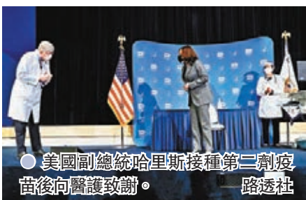
●美國副總統哈里斯接種第二劑疫苗後向醫護致謝。

美國總統拜登上任後，華府已向美國藥廠輝瑞和Moderna(莫德納)分別增購1億劑新冠病毒疫苗，期望在今夏交付，令美國至今訂購的新冠疫苗增至6億劑，預計在今夏結束前，可合共為3億名國民接種疫苗。輝瑞表示，有信心按照拜登政府的時間表提供額外疫苗。