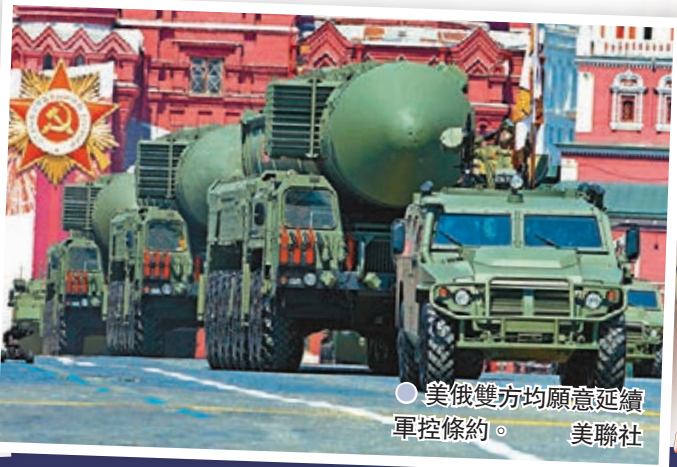
●美俄雙方均願意延續 軍控條約。