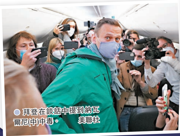
●拜登在談話中提到納瓦 爾尼(中)中毒。