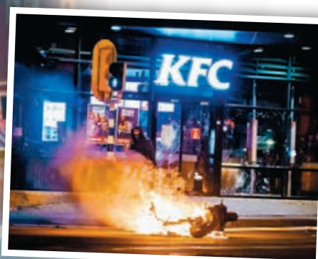
●荷蘭近期因實施宵禁，觸發當地40多年來最嚴重示威，有示威者焚燒車輛。