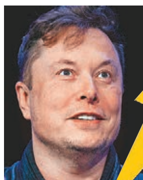
●馬斯克指控亞馬遜扼殺競爭。法新社

美國電動車巨企Tesla創辦人馬斯克，剛於本月初超越零售巨擘亞馬遜創辦人貝索斯，成為彭博富豪榜的全球首富。兩人除了在財富上互相競爭外，在開拓太空事業方面亦同樣具有野心，最近更就此隔空爆發罵戰。由於馬斯克名下的太空探索公司SpaceX近日向美國政府申請，將公司衛星計劃的衛星改至更低軌道，意味未來可能與亞馬遜的衛星軌道重疊，亞馬遜隨即提出反對，雙方更互斥對方阻撓公平競爭。