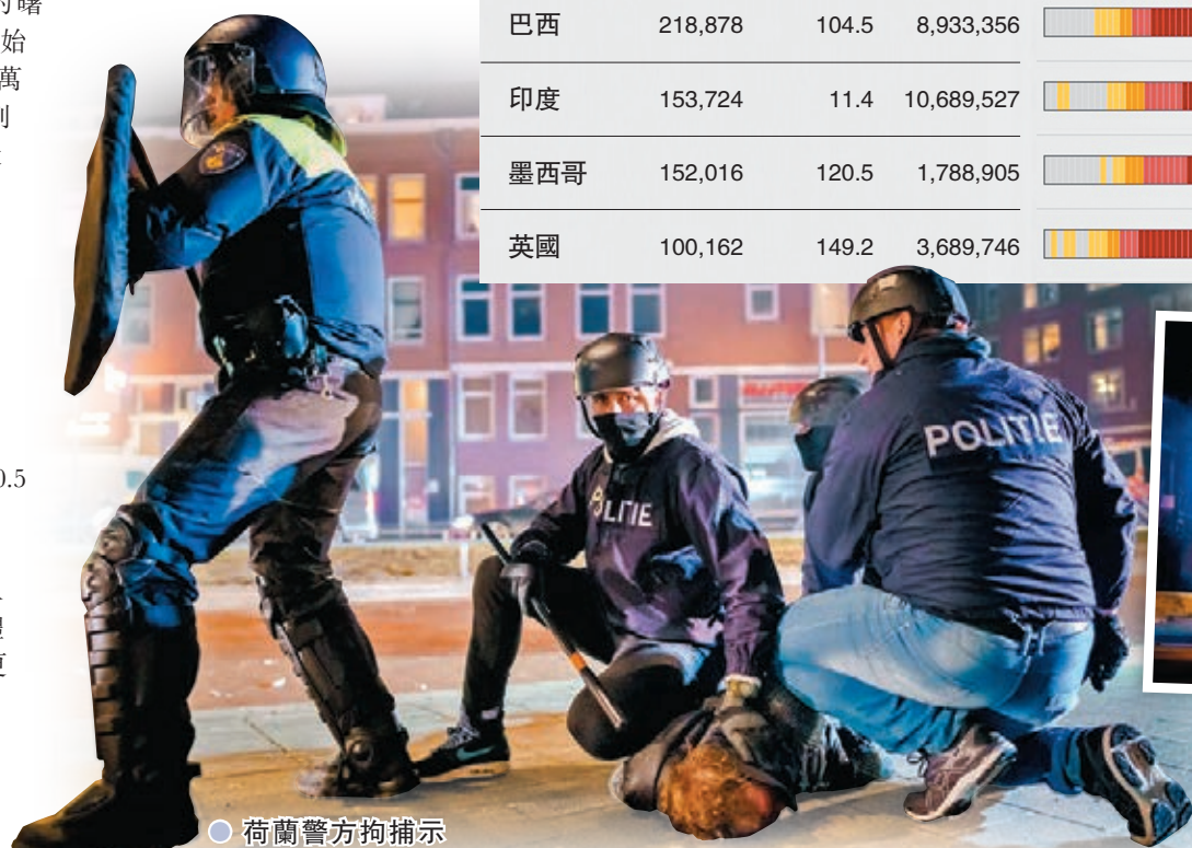
●荷蘭警方拘捕示威者。法新社