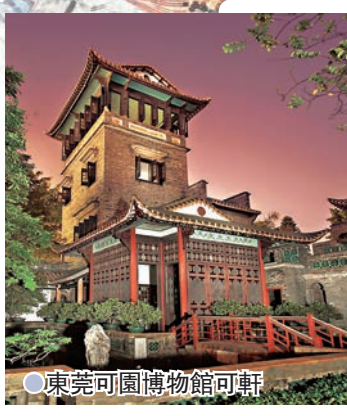
●東莞可園博物館可軒

坐落在東莞市城西博廈村的東莞可園，為廣東四大名園當中保留得最好的一個，是嶺南園林的代表，現為全國重點文物保護單位。可園最初名為「意園」，後改名為「可園」，園主為清末東莞人張敬修。可園佔地雖小，但整體空間布局合理，小巧玲瓏，園中建築、水池、登台、假山比比皆是，其造園意旨在於「幽」和「覽」，建築空間曲折豐富，四通八達，遊覽起來頗有趣味，尤其金魚池旁的可樓，更是可園中最高建築，共四層，是可園的標誌，登高遠眺，樓前長河盡收眼底，園後可湖，綠波蕩漾。