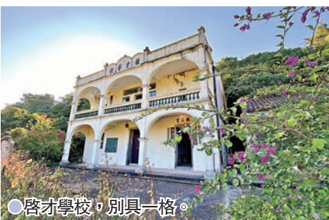
●啓才學校，別具一格。