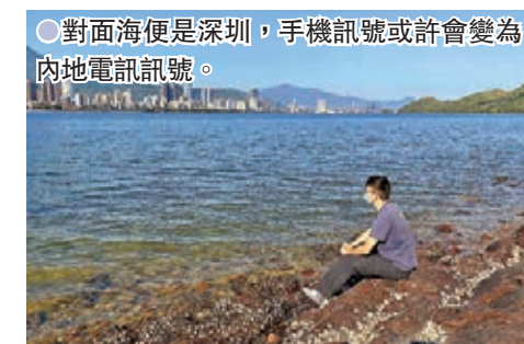
●對面海便是深圳，手機訊號或許會變為內地電訊訊號。