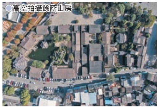
●高空拍攝餘蔭山房