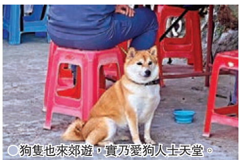
●狗隻也來郊遊，實乃愛狗人士天堂。