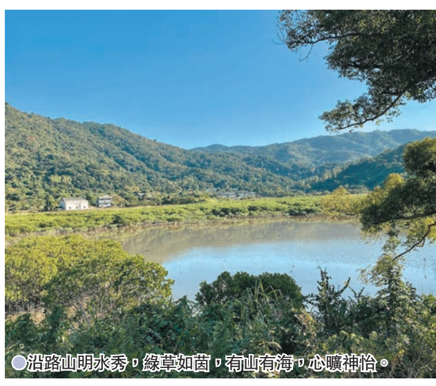
●沿路山明水秀，綠草如茵，看山看海，心曠神怡。