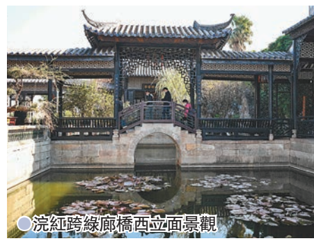
●洗紅跨綠廊橋西立面景觀