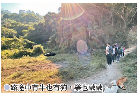
●路途中有牛也有狗，樂也融融。