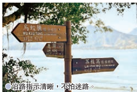
●沿路指示清晰，不怕迷路。