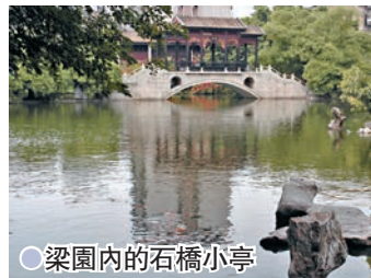
●梁園內的石橋小亭

位於佛山市松風路的梁園，是佛山梁氏宅園的總稱，主要由「十二石齋」、「群星草堂」、「汾江草廬」、「寒香館」等不同地點的多個建築群組成，規模宏大。梁園由當地書畫名家梁誦如、梁九章、梁九華及梁九圖叔任四人歷時四十餘年於清朝嘉慶、道光年間陸續建成。其建築布局精妙，宅第、祠堂與園林渾然一體，格調高雅，具有嶺南水鄉建築的特殊韻味。1982年起，佛山市對已年久失修的梁園進行搶救性保護，並於1994至1996年進行了大規模全面修復工作，修復後的梁園成為一個多視角、多層次展示嶺南古代文人園林特色的園林群體，堪稱「嶺南第一園」。