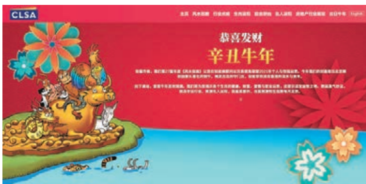
●中信里昂每年在農曆新年前，都會推出風水指數，從風水角度預測後市。

香港文匯報訊(記者 周紹基)全球在「鼠」年受盡新冠疫情折磨，即將踏入「牛」年，人人都希望有所轉機。中信里昂昨發表一年一度的風水指數，預計今年股市有得升，但漲勢在8月前後見頂，秋收時節則獲利回吐。主要是今年港股「八字」中，有兩個地支相沖，引發短時間急挫，但踏入第四季又會迎來反彈，並且在2022年1月前突然發力上衝。