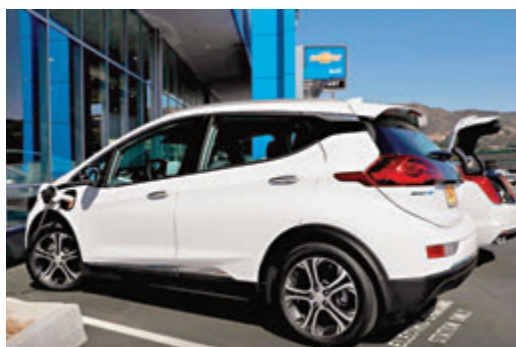
●拜登推動轉用電動車計劃。