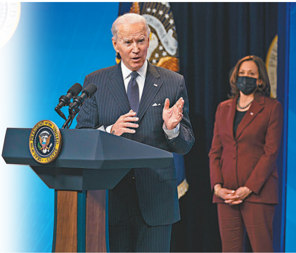
●拜登將採取多邊主義的手法與中國打交道。右為副總統哈里斯。