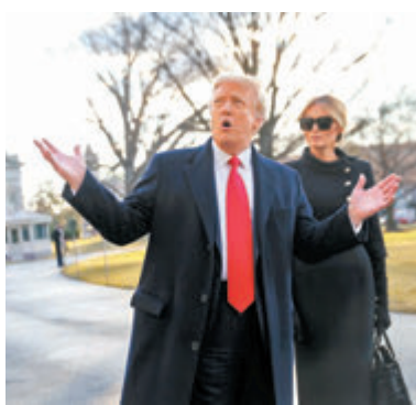
●特朗普涉嫌煽動暴動。

美國眾議院前日向參議院提交針對前總統特朗普的彈劾條款，參院將在下月8日正式展開彈劾審訊。彈劾條款指出，特朗普涉嫌煽動支持者衝擊國會，企圖推翻合法選舉結果。總統拜登前日表示，他認為有必要彈劾特朗普，但相信無法獲得足夠共和黨人倒戈，難以將特朗普定罪。