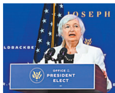
●耶倫成為美國首位女財長。

美國總統拜登提名前聯儲局主席耶倫出任財政部長，參議院前日以大比數通過提名，耶倫成為美國史上首位女財長，她上任後首要任務，將是推動拜登提出總值1.9萬億美元(約14.7萬億港元)的經濟紓困和抗疫方案在國會過關。