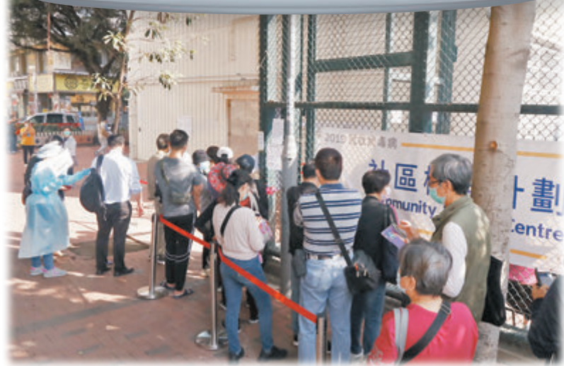
●本港疫情嚴重，市民期望能盡早接種疫苗。圖為市民早前到檢測站輪候檢測。