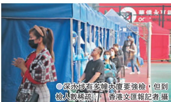
● 深水埗有多幢大廈要強檢,但到檢人數稀疏。