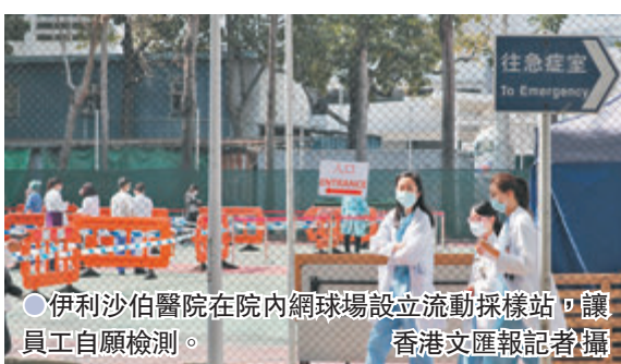
● 伊利沙伯醫院在院內網球場設立流動採樣站,讓員工自願檢測。