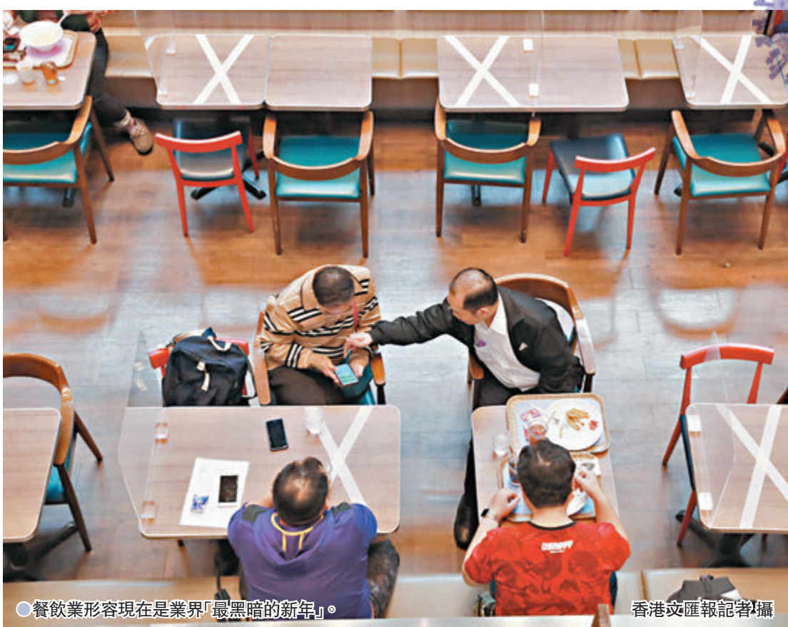
● 餐飲業形容現在是業界「最黑暗的新年」。

他又指,雖然現在外賣當道,但有五星級酒店同樣推出外賣盆菜及套餐「搶生意」,當然價格也較一般傳統酒樓的貴,但「平有平做」,普遍酒樓一個外賣套餐約三千多元,仍不及以往一頓堂食團年飯價格的一半,加上政府呼籲減少聚會,飯聚人數減少,有市民會選擇「散叫」,或者選擇較便宜的套餐,故對生意沒有太大幫補。 他說,第四輪防疫抗疫基金要在下月底才能完全發放,但相信有不少食肆已經難以經營下去,等到基金撥出款項前便已倒閉,加上3月是業界淡季,令情況雪上加霜。 他表示,業界一直滿足政府的防疫要求,甚至「做凸」,但由於有確診者曾到訪食肆而「一刀切」施加限制,對此感到無奈。 他認為政府應強制市民出入各場所須使用「安心出行」應用程式,才能夠發揮「追蹤」作用,以助控制疫情。