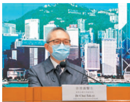
● 徐德義宣布社交距離措施將延長至2月3日。

香港文匯報訊(記者 文森)香港新冠肺炎疫情不停,昨日再增64宗確診個案,當中63宗屬本地個案,源頭不明佔21宗。食物及衛生局副局長徐德義指出,源頭不明個案比例持續上升,剛過去一周高達41%,缺乏條件放寬社交距離措施,故宣布原定明天屆滿的社交距離措施,將延長一星期至2月3日。 徐德義在昨日疫情記者會上匯報過去兩周新冠肺炎確診個案數據,本月12日至18日期間,錄得381宗個案,本地個案佔365宗,源頭不明個案佔32%;最近一星期,即19日至25日期間,共錄得494宗,本地個案佔469宗,源頭不明個案佔41%,而兩星期的無病徵個案亦佔36%。