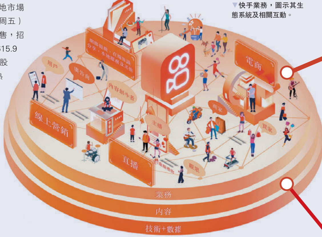
▼ 快手業務，圖示其生態系統及相關互動。

集資用途方面，籌款的35%將用於增強生態系統，30%用於加強研發及技術能力，25%將用於選擇性收購或投資，10%將用於營運資金及一般企業用途。預料認購人數及集資額或雙雙再破紀錄，甚至可能創下凍資破萬億元的紀錄。