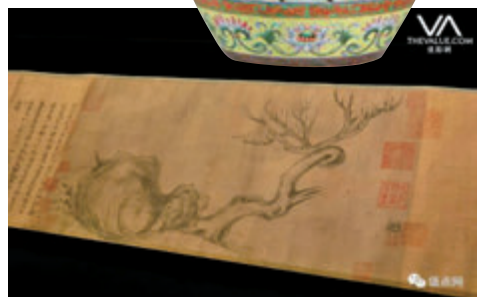
成交的蘇東坡真跡《木石圖》