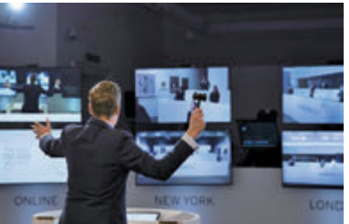
■ 破天荒的跨城直播拍賣，疫情下成業界常態。(網上圖片)

九如永寶應用微信小程序辦網拍，這是一項來自內地的網上買家。「現當代藝術鮮有真偽、狀況問題，故能快速適應疫情下的數碼浪潮。至於古董、書畫，價值深受真偽、狀況影響，高價頂尖拍品尤其，大家出手前都傾向於能作親身鑑賞。國際古玩展(HKIAF)總監翟凱東有精闢的分析見解。「疫情之下，收藏家大都無法親身參觀拍賣預展，難免競投時有所卻步。以瓷器為例，『上手』估計重量是分辨真偽之重要指標，修補或損壞的地方亦得『眼見』才知遺損嚴重。另一方面，拍品照片亦容易受現場燈光、後期調色等因素，令照片與實物顏色不一致。」