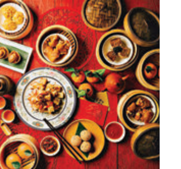
●龍苑賀年精美點心

「鼠去牛來辭舊歲，龍飛鳳舞慶新春」，金域假日酒店龍苑中菜廳與你一起迎接大吉大利的牛年，由即日起至2月28日特別為你預備多款精選賀年點心，如「鮑羅萬有」鮑魚海皇酥、「橫財就手」南乳花生炆豬手、「新春報喜」金瑤鴿蛋燒賣、「步步高陞」X.O. 醬炒蘿蔔糕、「松柏年年」黑松露野菌餃、「吉星高照」南瓜紫薯包、「大吉大利」蟲草花小籠包及「馬到功成」酥炸檸檬馬蹄條等，讓大與摯愛親朋共享佳節，歡度新春。