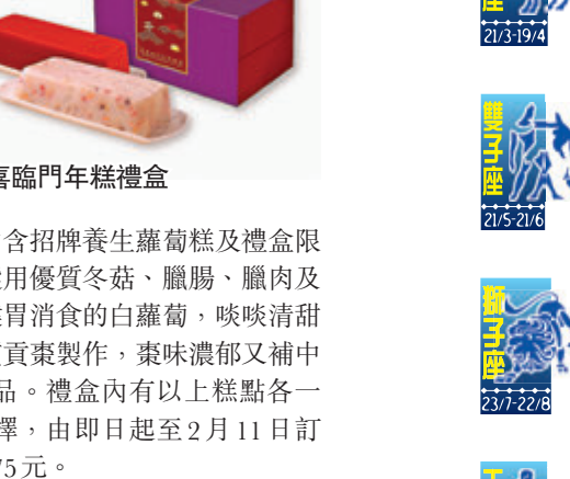
●雙喜臨門年糕禮盒

今年，東海飲食集團精心推出五款賀年糕點，包括今年之全新款式「雙喜臨門年糕禮盒」、清潤椰汁年糕、養生蘿蔔糕、滋味荔芋糕及桃姿馬蹄糕，當中全新「雙喜臨門年糕禮盒」內含招牌養生蘿蔔糕及禮盒限定全新口味香滑紅棗糕，蘿蔔糕選用優質冬菇、臘腸、臘肉及蝦米等惹味材料，配上高纖維且健胃消食的白蘿蔔，啖啖清甜鮮嫩。另一款香滑紅棗糕特選優質棗製成，棗味濃郁又補中益氣，入口清新鮮甜，是養生佳品。禮盒內有以上糕點各一盒，鹹糕甜糕成雙成對，任君選擇，由即日起至2月11日訂購，享八折早鳥優惠，只需港幣175元。