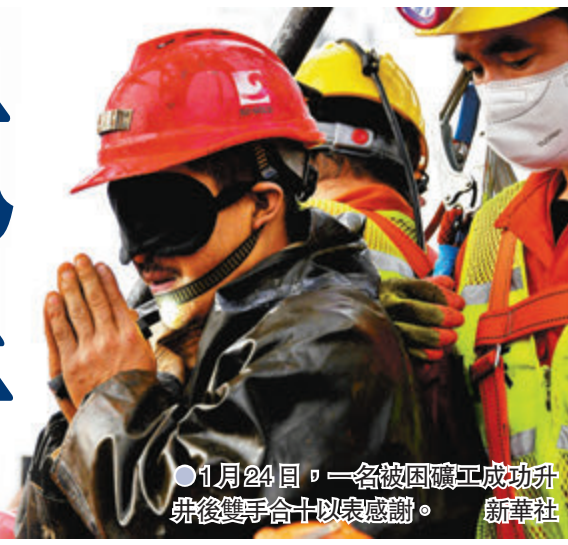
1月24日，一名被困礦工成功升井後雙手合十以表感謝。新華社