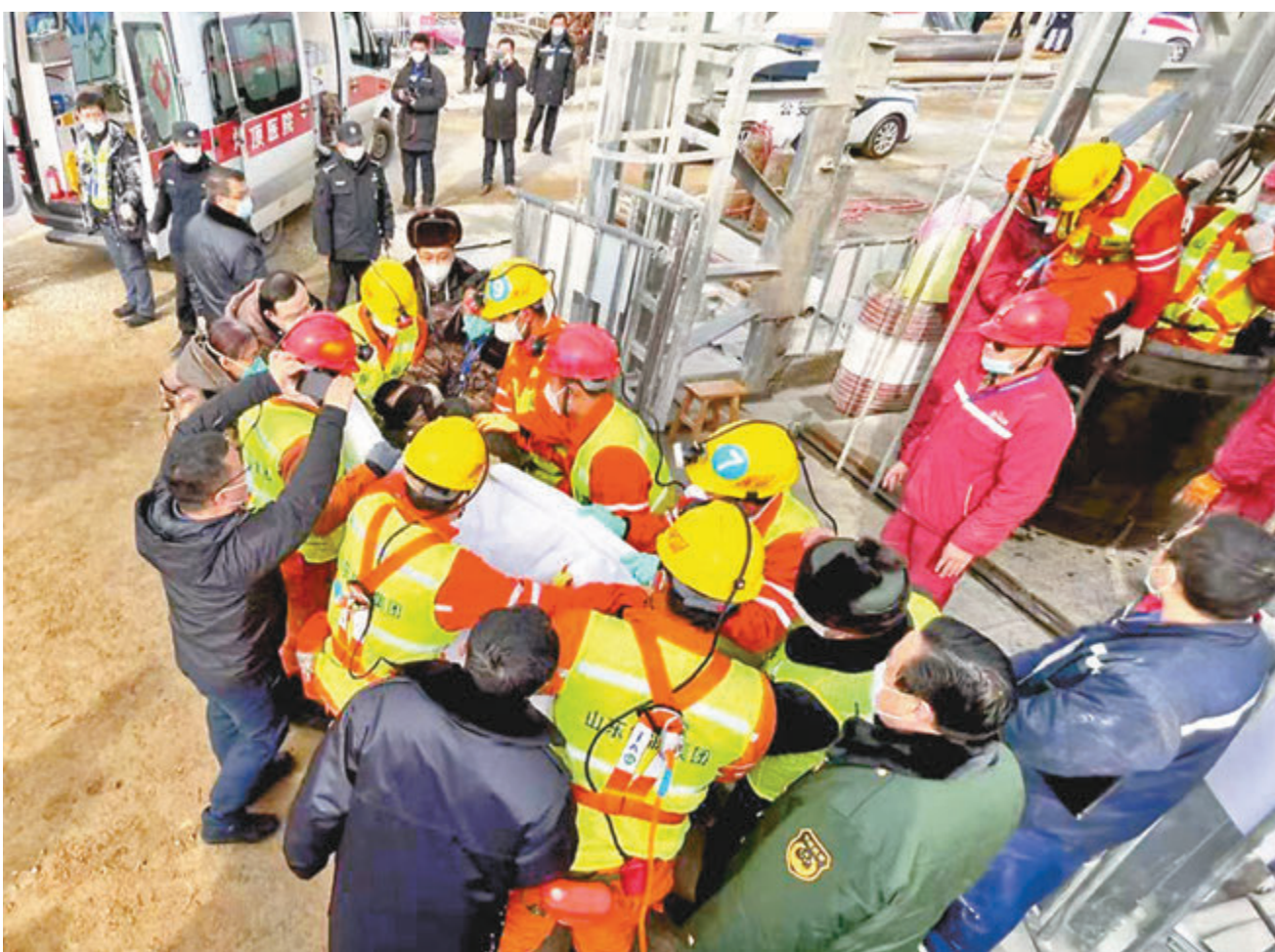
1月24日,山東煙台棧震笏山金礦爆炸事故現場有11名被困礦工在救援人員幫助下陸續升井。香港文匯報山東傳真

1月10日下午2時,棲霞市五彩龍金礦發生爆炸事故,井下有22名工人被困。截至24日18時,已有11名礦工升井獲救,另有1人確定死亡,其他10人仍下落不明。