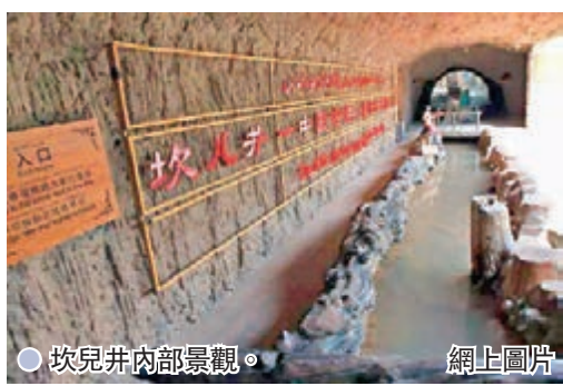
坎兒井井內景觀。網上圖片