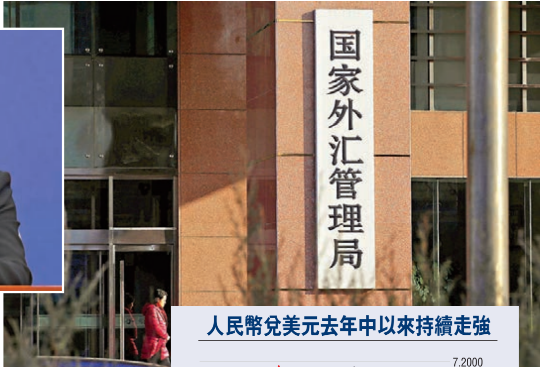
人民幣兌美元去年中以來持續走強