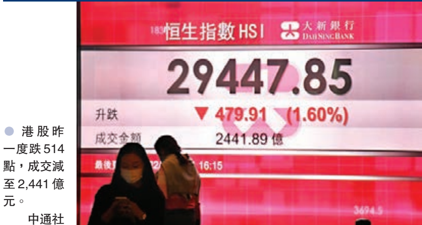
● 港股昨一度跌514點，成交減至2,441億元。

香港文匯報訊(記者 殷考玲)香港疫情始終未能受控，內地疫情近日也有所反彈，市場憂慮經濟數據不佳，加上恒指衝破3萬點之後，北水流入港股速度明顯減慢，導致恒指昨日挫479點，收報29,447點。藍籌股幾乎全線向下，滙控(0005)、友邦(1299)跌逾2.6%。不少分析認為，近日利好消息已經盡出，預期下周四(28日)期指結算日前恒指都會反覆偏軟。