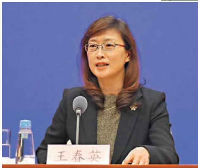
●王春英認為，去年下半年以來，人民幣兌美元匯率回升的原因主要是內外部環境變化的市場結果。