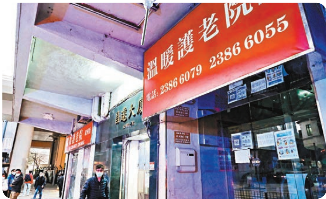
●衛生署公布疫苗使用指引，安老及殘疾院舍的院友和職員是最優先接種群組。圖為一安老院舍。資料圖片