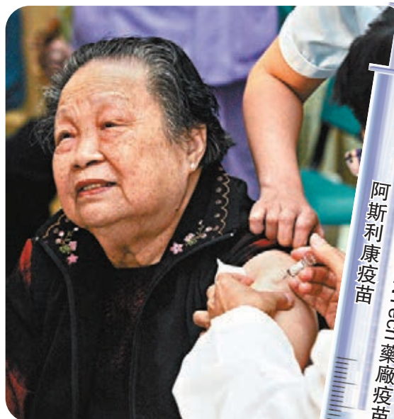
●有委員表示，傾向先為長者注射復星/BioNTech疫苗。圖為一長者接種情況。

陳肇始昨日在立法會回應施政報告致謝動議發言時表示，政府會爭取疫苗盡早供港，估計在農曆年後開始接種計劃，而政府會為部分群組優先注射疫苗，並檢視其他可能需盡早接種的特定群組，如對香港基建及運作重要的人士，政府亦安排在全港18區設社區疫苗接種中心，或通過私家醫院或診所為市民注射，目標是今年內免費為大部分市民接種疫苗。