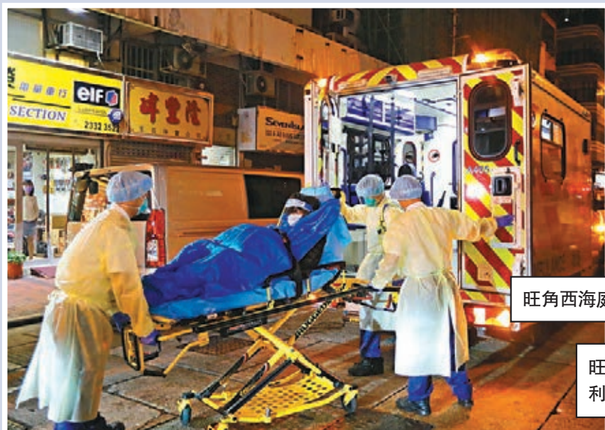
○佐敦炮台街一間老人院有院友初確，同層院友和員工須送往檢疫。